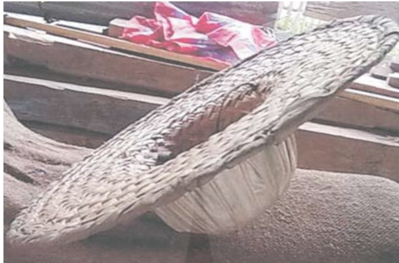
Gambar 3. Topi Sapeo dari P. Kobaena

Kerajinan anyam pada masa lalu banyak dipakai untuk perlengkapan upacara adat atau tradisional namun masa kini karya anyam banyak dipakai untuk kebutuhan atau keperluan sehari-hari atau untuk hiasan interior rumah. Meskipun bentuk sudah menyesuaikan keinginan pasar tetapi teknik dan bahan dasar masih mengandalkan pengetahuan turun temurun dari nenek moyang.