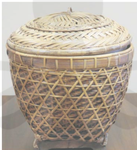
Gambar 1. Keranjang Penarak dari Bali

Penarak sebagai hasil kerajinan anyam dari Bali yang difungsikan pada upacara tradisional adat Bali. Keranjang Penarak ini digunakan untuk membawa sesajian pada waktu upacara kematian. Di bawah ini adalah gambar keranjang penarak dari Bali. (Widjaja, dkk, 1989:12).