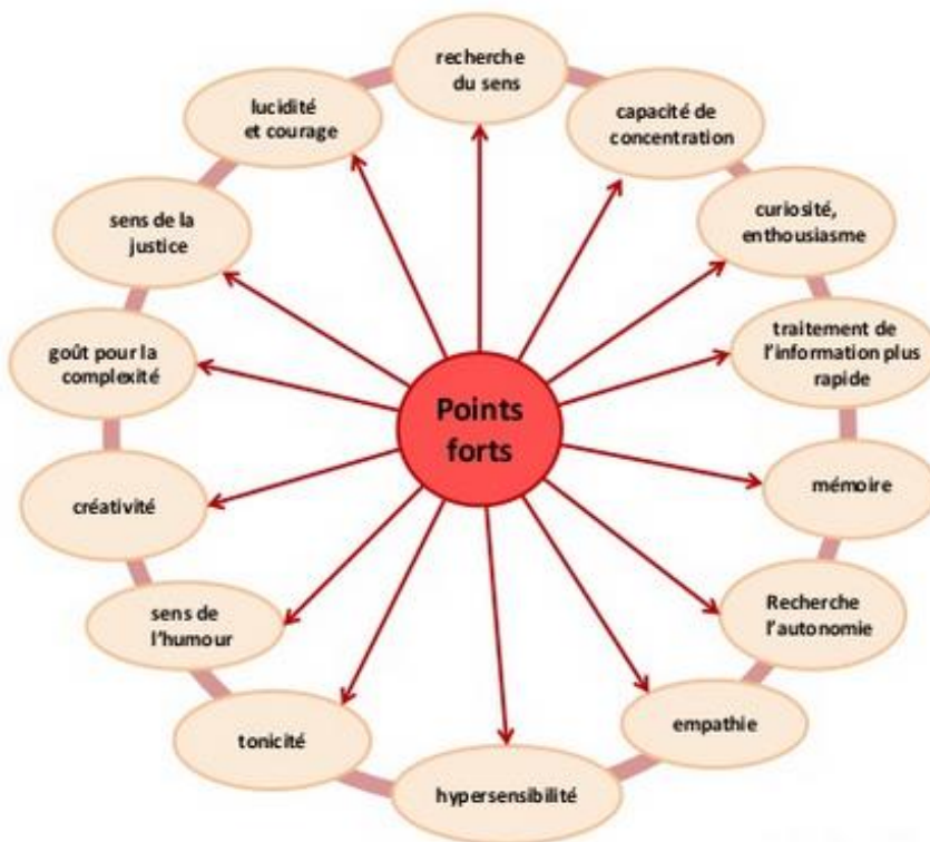
Figure 1 : Les points forts de l'élève HPI 2