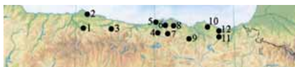
Fig. 3. Mapa que refleja algunos de los yacimientos asociados al Chatelperroniense en la región cantábrica a lo largo de la Historia. 1. Cueva del Conde. 2. Cueva Oscura de Perán. 3. La Gúelga. 4. El Castillo. 5. El Pendo. 6. El Otero. 7. Cueva Morín. 8. El Otero. 9. El Polvorín. 10. Santimamiñe. 11. Labeko Koba. 12. Ekain.

para la región cantábrica de la Península Ibérica. Tal y como se ha reflejado en la parte del trabajo dedicada al registro cronológico del Chatelperroniense, la cuestión fundamental es que esas cronologías serían contemporáneas de niveles musterienses y aurinienses, implicando, como consecuencia, la convivencia entre los Neandertales y los Humanos Anatómicamente Modernos en un medio geográfico, la región cantábrica que, a priori , no parece que haya modificado sus patrones de hábitat durante épocas musterienses, chatelperronienses y aurinienses.