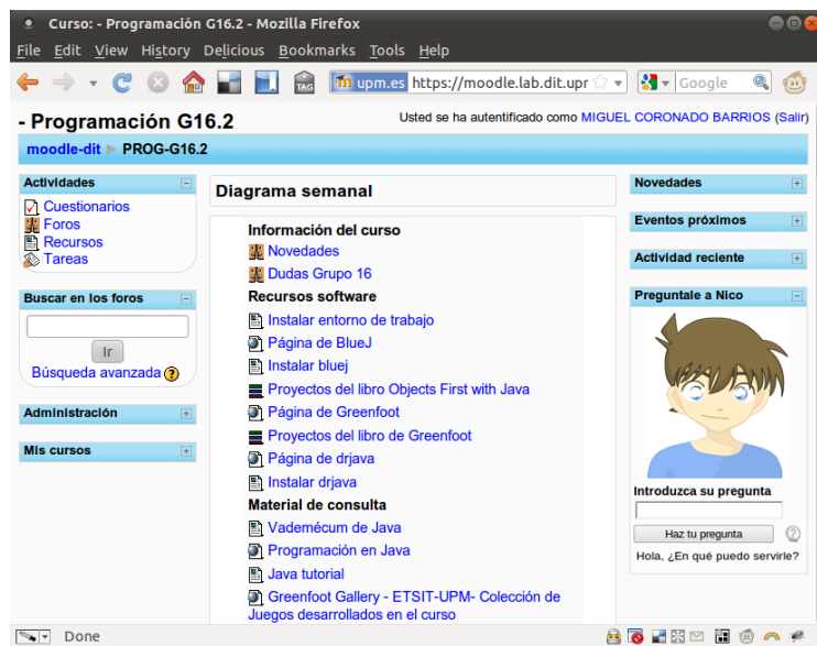
Figura 4. Interfaz de conversación con alumnos integrada en Moodle

La interfaz de alumnos de TutorGSI se integra dentro de la de Moodle como un módulo que puede colocarse en cualquier actividad definida en un curso de Moodle. Se ha desarrollado así porque, al ser Moodle una plataforma con un gran número de usuarios, se pretende que tanto los alumnos como profesores, estén acostumbrados a manejarse por la interfaz de manera que el uso de las funcionalidades que añade TutorGSI sea intuitivo. En la Figura 4 se puede ver un extracto de la interfaz de alumnos.