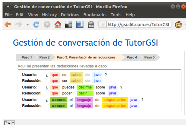
Figura 5. Asistente para el desarrollo de una conversación

El punto de partida es un conjunto de consultas similares que debe introducir el profesor, generalmente estas consultas son extraídas del corpus. El sistema analizará sintácticamente todas las frases resolviendo las ambigüedades que puedan surgir en función del género y número de cada palabra. Una vez resueltas, las frases vuelven a ser analizadas en busca de las palabras clave que serán incluidas en los patrones de AIML. Posteriormente el profesor debe introducir las respuesta que el bot debe dar a cada una de las consultas anteriores, esta información también será extraída directamente del corpus.