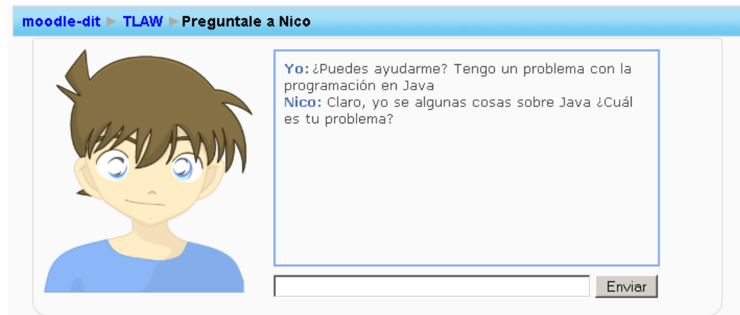
Figura 1. Avatar de Nico, el tutor virtual

Para la realización de este estudio se ha desarrollado el sistema TutorGSI, que da solución a los problemas mencionados anteriormente en el marco de la asignatura de Programación impartida en el primer curso del Grado en Ingeniería de Tecnologías y Servicios de Telecomunicación de la Universidad Politécnica de Madrid.