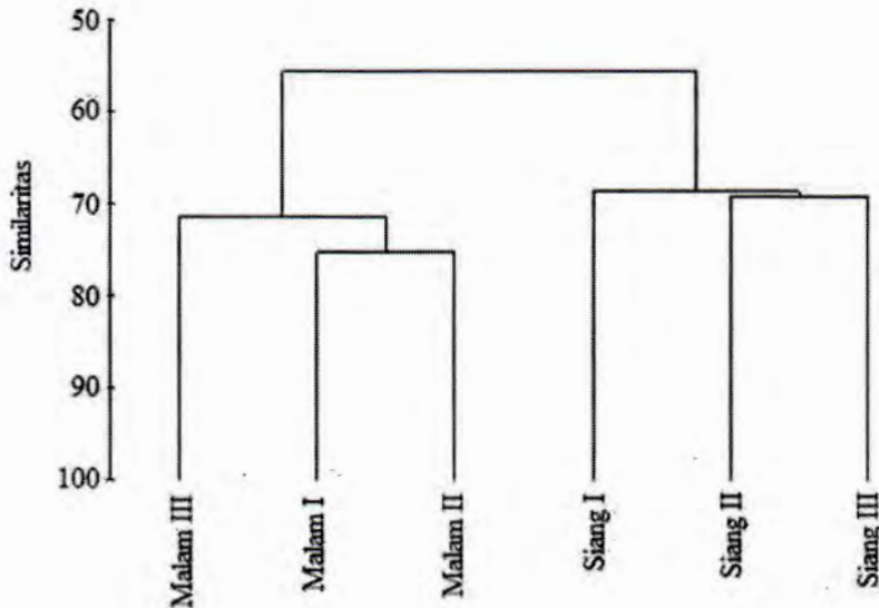
Gambar 3. Dendrogram pengelompokan kesamaan spesies ikan padang lamun berdasarkan kehadirannya di perairan Tanjung Tiram-Teluk Ambon Dalam antara siang dan malam hari