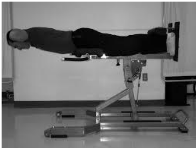
Slika 1: Prikaz Biering Sorensenovog testa za procjenu statičke jakosti ekstenzora trupa (66)

Mjerni postupak za provođenje motoričkog testa za procjenu statičke jakosti fleksora (pregibača) trupa testom „izdržaj u uporu na podlakticama“