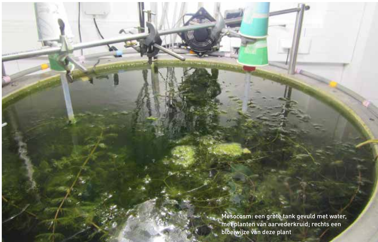
Mesocosm: een grote tank gevuld met water, met planten van aarvederkruid; rechts een bloeiwijze van deze plant