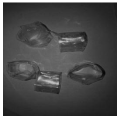
Gambar 2. 1 Modifikasi Botol Plastik Bekas

Media biofilter yang digunakan adalah botol plastik bekas yang telah dimodifikasi dengan cara dipotong pada ukuran 2 x 10 cm dan digulung hingga terbentuk silinder dengan beberapa lapisan seperti pada Gambar 2.1 sebagai berikut;