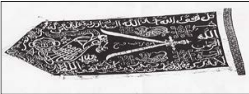
Gambar 1. Bendera Macan Ali koleksi Museum Tekstil Jakarta.