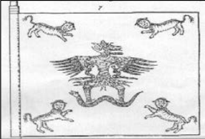
Gambar 2. Bendera Garuda E, dari Kerajaan Bone.