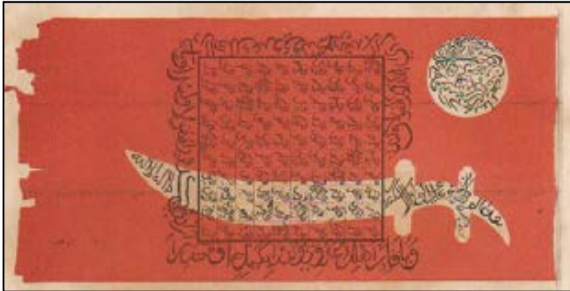
Gambar 3. Bendera Ulabulu/Ula Balo E dari Kerajaan Bone.