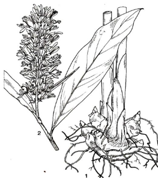
Gambar 1. Alpinia galanga 1. Rhizoma; 2. Taruk (shoot) dengan pembungaan (de Guzman and Siemonsma, 1999).

Alpinia galanga banyak digunakan sebagai bumbu masak (spices), yang menghasilkan rasa pedas seperti lada ( Piper nigrum ) dan jahe ( Zingiber officinale ) serta aroma yang khas. Sebagai bumbu masak bagian yang dimanfaatkan adalah bagian rimpang atau rhizoma yang telah tua. Berbagai masakan memanfaatkan rhizoma A. galanga sebagai komponen utama maupun sebagai komponen tambahan seperti ayam goreng,