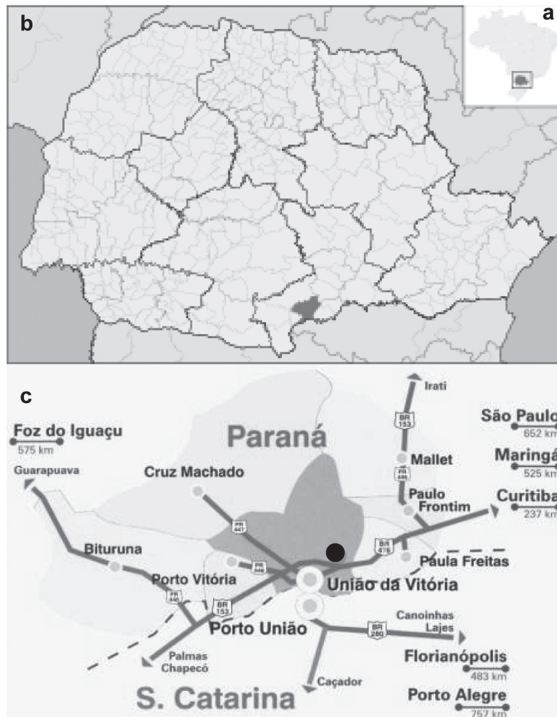
Figura 1 – Mapa do Brasil indicando a localização do estado do Paraná (a), do município de União da Vitória (b) e da área de estudo (c), representada pelo símbolo - ● - dentro do município.

(IAPAR, 1994). A área utilizada neste estudo consiste em um fragmento florestal de área aberta (mata secundária), localizada em uma propriedade particular (Chácara Camargo), situada nas imediações da cidade de União da Vitória – PR (figura 1).