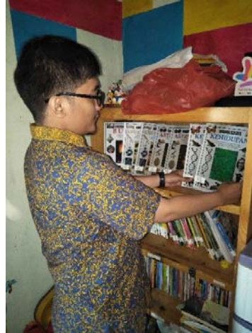
Gambar 4. Tim Pelaksana Pengabdian kepada Masyarakat