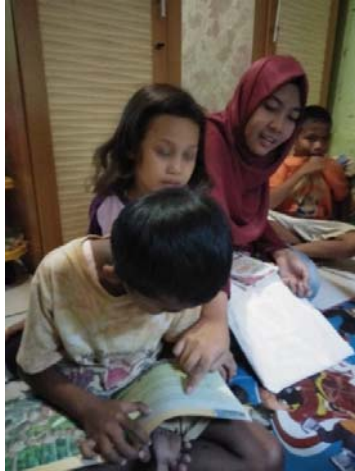
Gambar 3. Peserta Pengabdian kepada Masyarakat