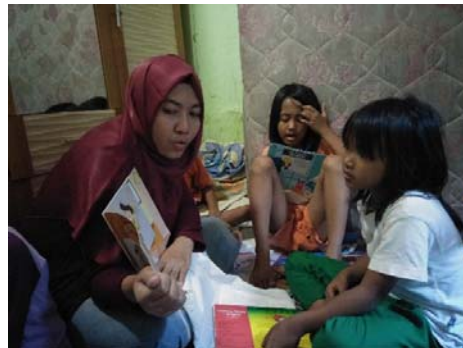
Gambar 6. Tim sedang melakukan kegiatan