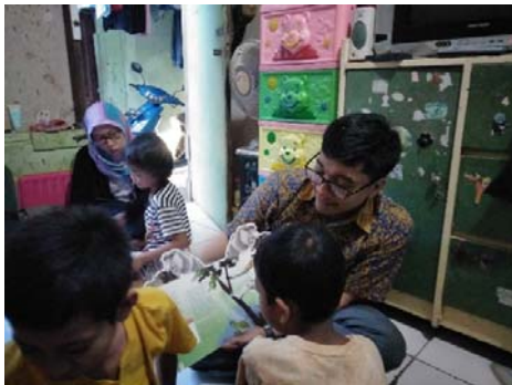
Gambar 5. Tim sedang melakukan kegiatan