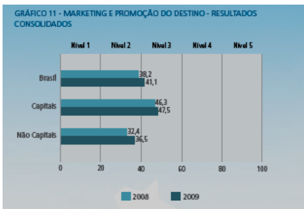
Figura 2: Resultados Nacionais