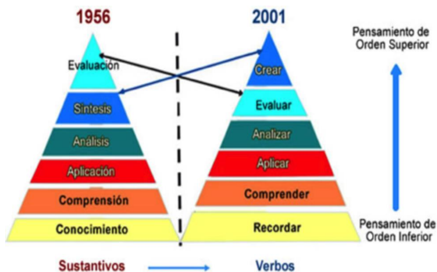
Figura 1: Taxonomía de Bloom Revisada

En la figura anterior, se puede observar el cambio de los dos últimos niveles de pensamiento de orden superior, evaluar y crear .