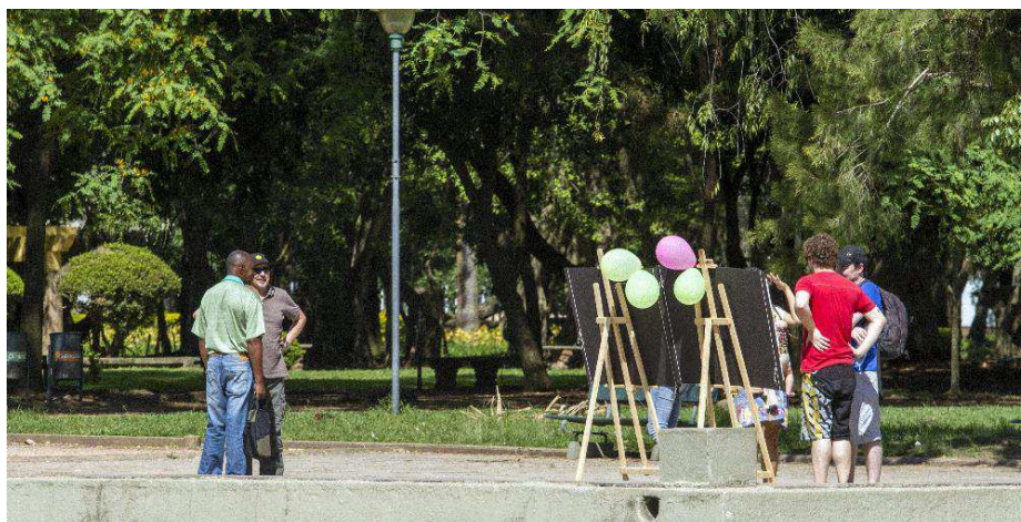
Figura 2 - Visualização dos cartazes de simulação do cercamento do Parque da Redenção, destinado ao empreendimento privado.