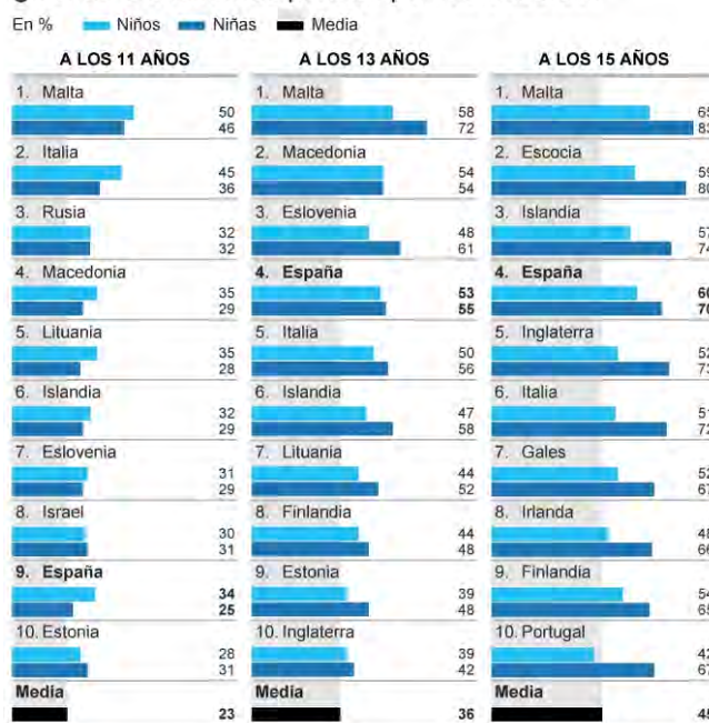
Gráfico 3. Evolución de la presión percibida por los adolescentes respecto a los deberes

(OMS, 2016, pag 261. Gráfico creado por el periódico El Mundo)