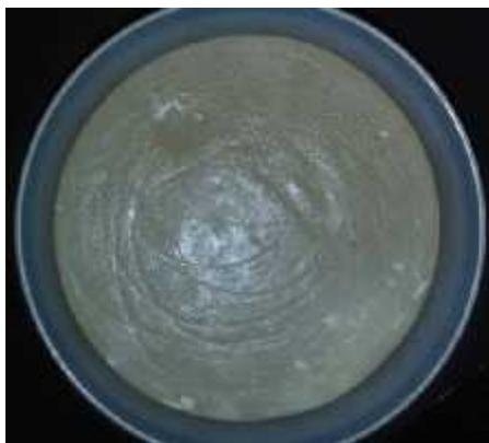
Gambar 1. Sabun pembersih wajah dari air leri

Gambar 1 menunjukkan tentang sabun pembersih wajah dari air leri yang nantinya akan dilakukan analisis lebih lanjut yaitu kadar air, derajat keasaman, angka penyabunan dan angket kepuasan dari konsumen.