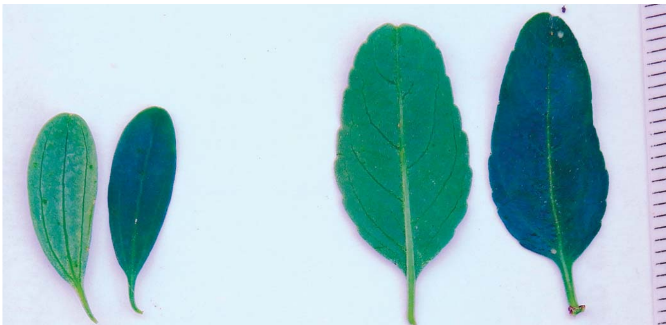
Imagen: A. Medina

Por otro lado, la madera de estas especies presenta características estéticas valiosas (ver Figura 4) para su uso en artesanías y piezas de poca talla. Existen también registros históricos que refieren el uso