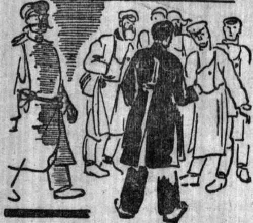
— А тут интересная история затевается.

— А шо? — Вегем, говорю, убью! Подожла старуха.