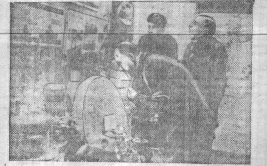
Делегаты съезда осматривают во время перерыва выставку.

Все обязательства перед государством мы должны аккуратно выполнять, с оговором и полностью. (Аплодисменты).