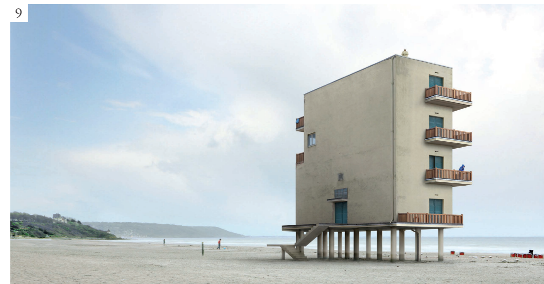
Figura 9 Filip Dujardin, D'ville 005 , 2012. Impresión en chorro de tinta sobre papel perlado, 110x70 cm. Designboom . [consultado el 1 de junio de 2019]. Disponible en: https://www.designboom.com/art/impossible-architecture-by-filip-dujardin/ .

La duración de estas imágenes depende por tanto de lo que dure la reflexión que suscitan, la idea que representan, o el lugar que tratan de comunicar, liberándose cada vez más de la función que una vez tuvieron de documentar y mediar la propia que las produjo.