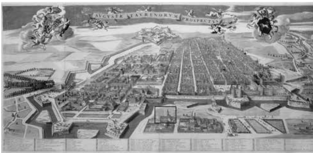
Fig. 102. Torino, via Maria Vittoria 7c. Individuazione dell'area di intervento sul Theatrum Sabaudiae (da Theatrum Sabaudiae I, 9).

La prima fase di occupazione successiva a quella romana attestata nel corso dello scavo è, tuttavia, rappresentata dalla predisposizione di un sistema di canalette e pozzi perdenti sette-ottocenteschi.