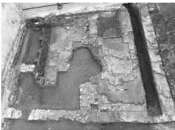
Fig. 104. Torino, via Maria Vittoria 7c. Struttura ottocentesca riferibile agli impianti del palazzo.