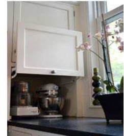
Hinged cabinet. Love this to hide appliances