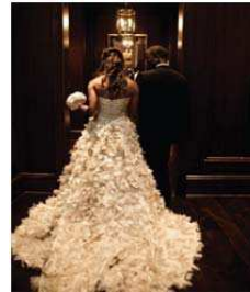
Love this train

tareas como la creación de modelos de usuarios, análisis de sentimientos y publicidad personalizada, hasta donde sabemos este tipo de comentarios específicos aún no ha sido completamente estudiado.