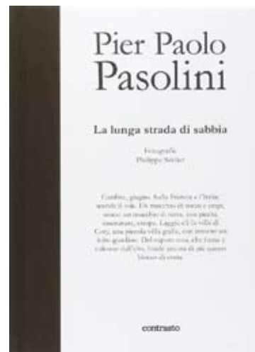
Pier Paolo Pasolini La lunga strada di sabbia Edizioni Contrasto, 2014 ISBN 978-88-6965-541-8