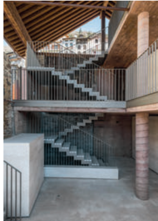
3 Des parois ouvertes protégées par le toit. | Pareti aperte sotto un tetto che funge da protezione.