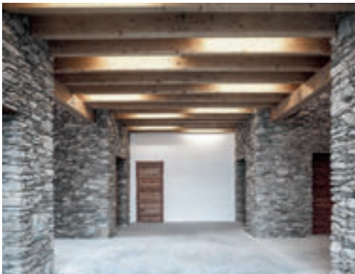
2 Une grande variété d'espaces. | Un'ampia varietà di ambienti.