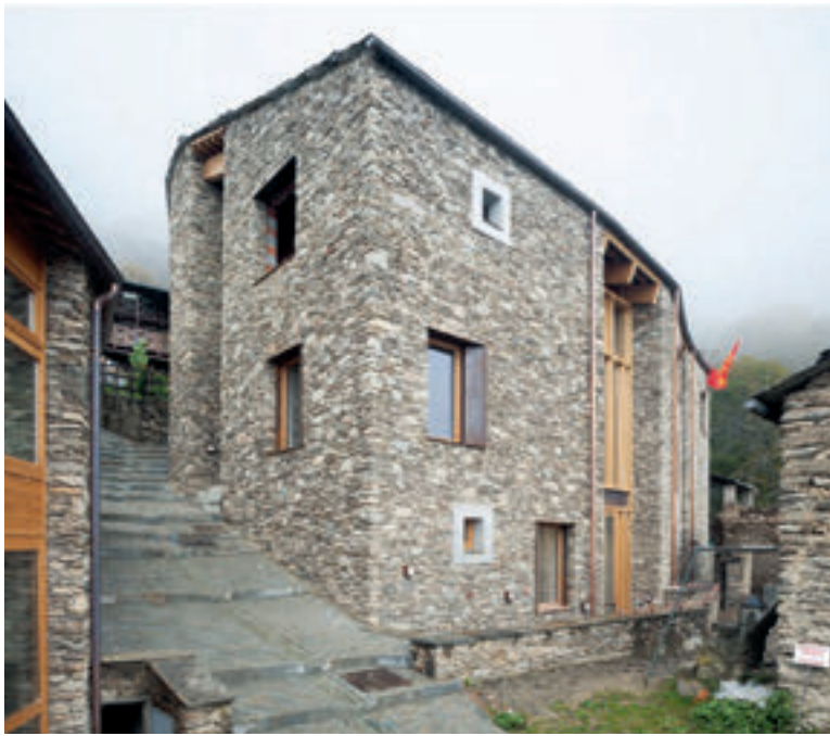
2 La ruine est devenue un centre culturel. | La casa in rovina è stata trasformata in Casa della Cultura.