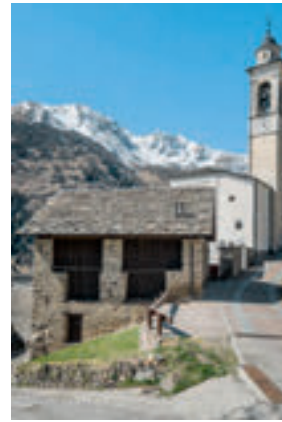
3 L'ancienne étable est aujourd'hui une chapelle funéraire. | La vecchia stalla è diventata una cappella mortuaria.