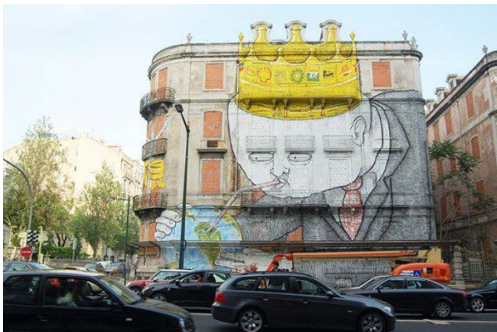
Figure 4 - A Blu and Os Gemeos' large mural painted in 2010 on a building in Lisbon. ( http://blublu.org/ )

Figura 4 - BLU, 2010, Blu in collaborazione con Os Gemeos realizza un grande murales su un palazzo di Lisbona. ( http://blublu.org/ ).