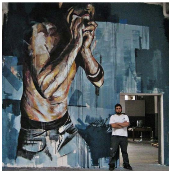
Figura 5 - Fabrizio Visone, murales realizzato alla fabbrica di via Foggia, Torino, progetto Urbe Rigenerazione Urbana, 2011 – murales realizzato al Street art Festival 2011 di Campobasso; ( www.fabriziovisone.com ).