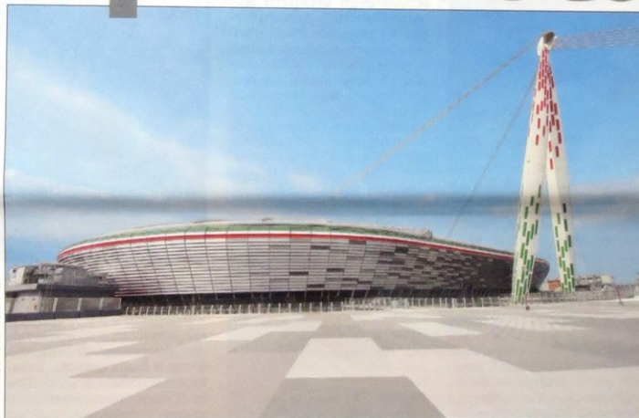
Ma l'unica a passare dalle intenzioni ai fatti è la Vecchia signora. Il nuovo stadio della Juventus è stato inaugurato l'8 settembre a Torino in sostituzione del mai amato Delle Alpi; per il momento, è l'unico impianto italiano di proprietà privata di un grande club calcistico

SPECIAZIONE IN A.P. - 45% D.L. 35/2003 (CONV. IN L. 27/02/2004 N° 46) ART. 1, COMMA 1, DCEI TORINO MENSILE N. 98 OTTOBRE 2011