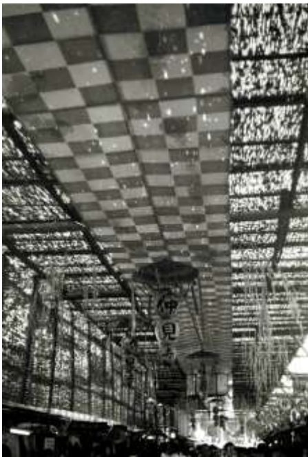
Fig. 17. Bernard Rudofsky, foto de una calle comercial japonesa, 1955.

Entre las muchas observaciones pioneras de Rudofsky, estuvieron las relacionadas con el control del microclima. En sus casas de Brasil, las «habitaciones exteriores» y su vegetación fueron diseñados a fin de crear un microclima agradable. Observó que la tecnología avanzada rechazaba la luz natural, el calor radiante del sol, la brisa para proponer «envolventes» que se apartaban de la naturaleza y consumían mucha energía. En Streets for People , ofreció algunos ejemplos de acondicionamiento ambiental urbano, que incluían protecciones solares (toldos, cañizos, esteras que cubren los espacios públicos) y pasajes cubiertos. [FIG17]