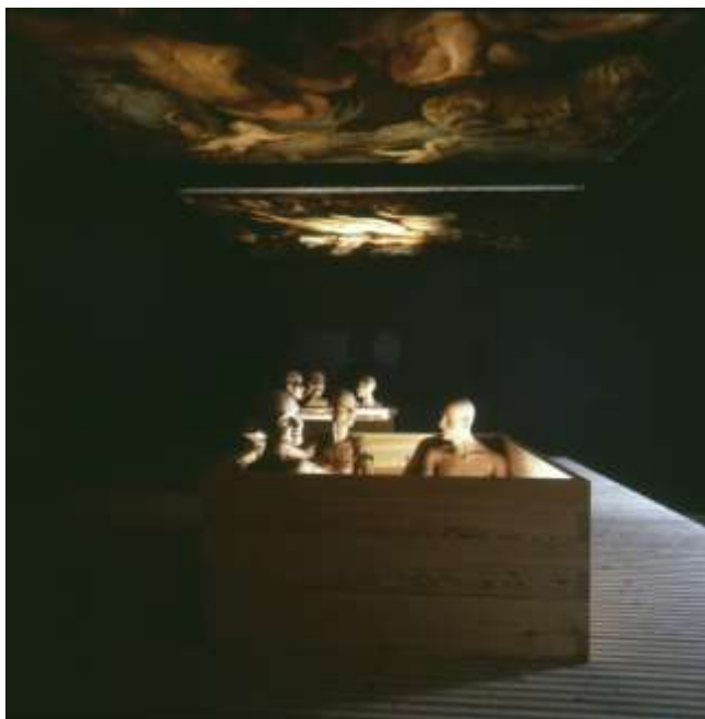
Fig. 16. Gerald Zugmann, foto del «baño convivial» en la exposición de Bernard Rudofsky Sparta/Sybaris , MAK, Viena, 1987.

Otra cuestión sobre la que Rudofsky tenía preferencias exóticas era la de defecar en cuclillas, en lugar de sentado: elección que facilitaba el éxito de la actividad. Prefería, por tanto, la taza turca a la taza habitual; el cuarto donde se colocaba esta podía ser un espacio mínimo pero con gracia, como el japonés tradicional, «un lugar para la contemplación, una guarida para filósofos» 63 .