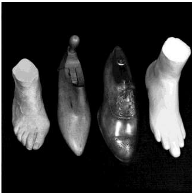
Fig. 1. Esta fotografía de Barbara Sutro para la exposición y el libro Are Clothes Modern? expresa quizá mejor que cualquiera otra la evidencia de la responsabilidad de los diseñadores, que crean sus obras no pensando en la realidad de los seres humanos sino en modelos ficticios.

La cuestión de la modernidad no es solo de la racionalidad formal, o de comodidad. Rudofsky basaba la necesidad de un enfoque diferente de la vivienda y del vestido también, o sobre todo, en la salud y en la felicidad: en resumen, en el equilibrio psicofísico. Pensaba que era inútil abordar el proyecto (o la elección de compra) sin plantearse radicalmente la cuestión de cuáles son las necesidades. Esto no significa, sin embargo, que Rudofsky no fuera consciente de las fuerzas que apartaban de tal enfoque — o que hacen tomar decisiones que lo contradicen. El conformismo, el estatus y la respetabilidad social y, en el caso de la ropa, la atracción erótica pueden vencer incluso la evidencia de la incomodidad y la patogénesis. «La cuestión de fondo sobre el vestido (...) es que se ajusta a las personas mentalmente, no físicamente» 9 .