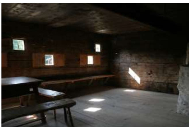
Fig. 15. Este interior de una casa vernácula austriaca expresa el concepto rudofskiano de «lujo del espacio», resultado de la simplificación o de la escasez. Foto de Andrea Bocco Guarneri, Salzburger Freilichtmuseum, Großgmain, 2013.

Para Rudofsky, el fracaso de una arquitectura verdaderamente moderna se medía por el hecho de que una parte importante del espacio de las viviendas estuviera inmovilizado: por ejemplo, había habitaciones reservadas a la función de dormir, permanentemente ocupadas por camas.