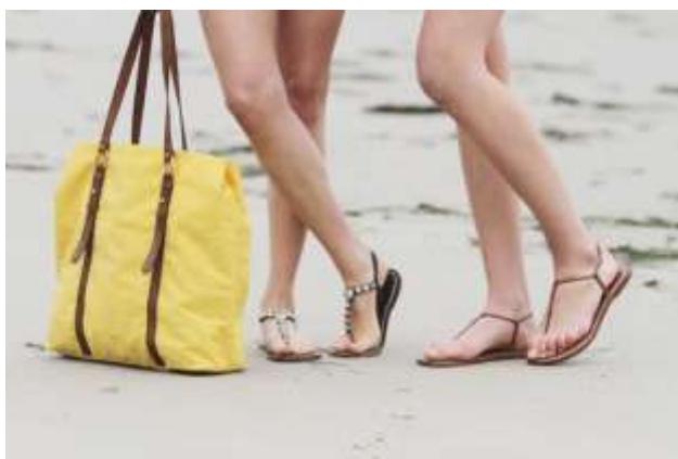
Fig. 9. Fotografía de Tony Modugno para el blog de moda Goldenwhitedecor.com . Las «golden girls» Lauren y Marika, titulares del sitio, calzan Bernardo Sandals « Milly » (a la derecha) y « Mojo » (a la izquierda) en este servicio de 2013. El primer modelo está indicado por el productor como diseñado por Rudofsky.

Todo lo que hemos dicho hasta ahora tiene que ver directa o indirectamente con una cuestión de fondo: que se ha perdido, decía Rudofsky, una actitud generosa hacia el cuerpo, que debería haber sido objeto de cuidado. Hoy en día, hay industrias enteras que se lucran con el afán por mantener el cuerpo en condiciones deseables: de los tatuajes a la cosmética, del fitness a la cirugía plástica. Rudofsky hubiera considerado todo ello como costosas maneras de ocultar el verdadero problema, mucho más íntimo — de relación entre la mente y el cuerpo de cada individuo — pero no por eso sin consecuencias para grupos enteros de personas; consideraba, por ejemplo, que los elevados niveles estéticos de la antigüedad fueron el resultado de un feliz equilibrio entre mente y cuerpo, y que su saludable respeto por el cuerpo había producido maneras inteligentes y vestimenta cómoda, con ropa holgada y zapatos abiertos, como sus preciosas Bernardo Sandals . [FIG09]