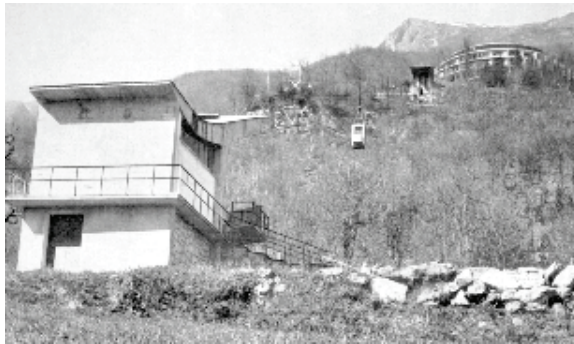
La teleferica di collegamento tra il fondovalle e la casa (da Il Messaggio del Getsemani , 1961).