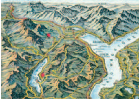
La posizione del Getsemani di Casale Corte Cerro in una cartolina postale degli anni Sessanta circa.