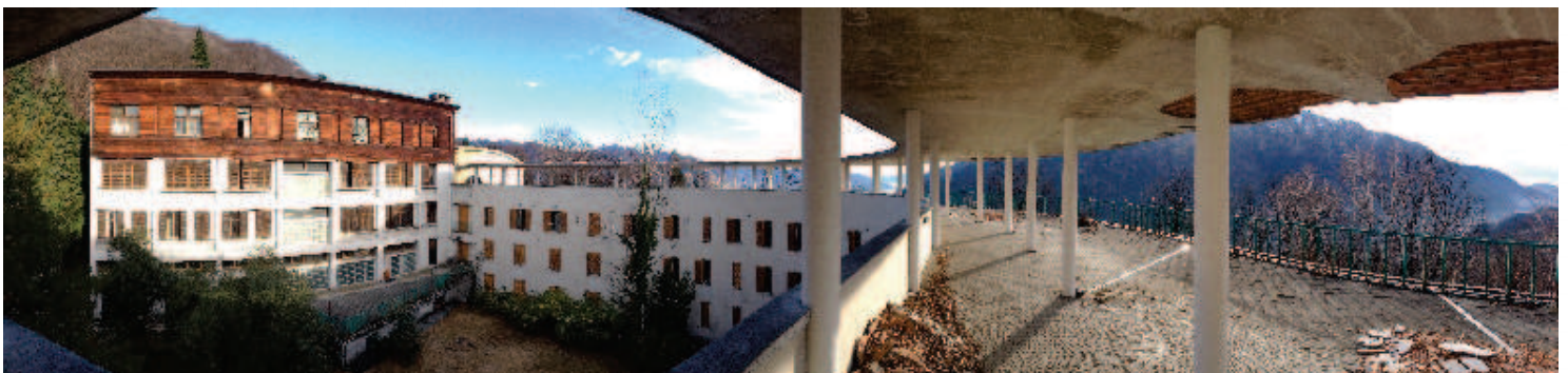
Il chiosstro panoramico sulla Manica Curva e il centro servizi della Manica Retta, nella situazione attuale.