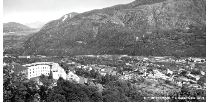
Il Getsemani e il sottostante paese di Casale Corte Cerro in una cartolina degli anni Cinquanta.

monte" evangelica (Mt 5, 14) in senso tutt'altro che metaforico: è una vera e propria piccola città, un microcosmo autonomo, dotato di ogni comfort necessario per un adeguato percorso di maturazione spirituale, incluso un cinematografo per le iniziative di propaganda interna; al tempo stesso, il luogo è inaccessibile con mezzi meccanici, ad eccezione di una ardita teleferica; infine, la casa è visibile, ma al tempo stesso domina la visuale su un paesaggio di straordinaria bellezza, ma anche di straordinaria importanza viaria, nello snodo tra la valle d'Ossola, il Verbano e la conca del Cusio, sull'unico poggio da cui si possono abbracciare con lo sguardo i laghi d'Orta e Maggiore.