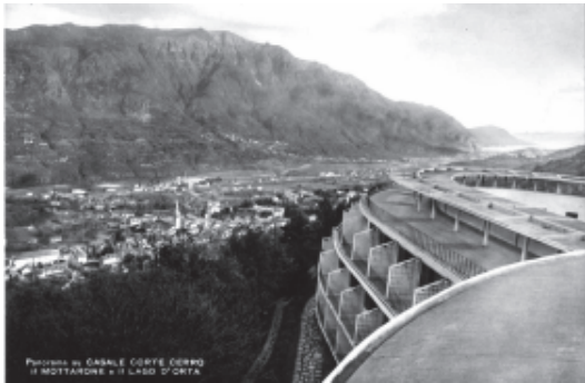
Il chiostro panoramico e l'affaccio delle 'celle', in una cartolina degli anni Cinquanta.