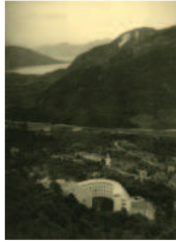
Il Getsemani affacciato sulla valle Strona e verso il Lago Maggiore, 1953 circa