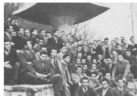
L'altare della memoria, con un gruppo di militanti (da Il Messaggio del Getsemani , 1961 e Il Getsemani , 1957).