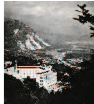
Il Getsemani e il Montorfano, in una foto d'archivio della Presidenza Generale dell'Azione Cattolica (ISACEM, Roma)

rete di camminamenti esclusivamente pedonali permette di godere del verde e del silenzio, collegando all'edificio principale una serie di emergenze, interpretabili come le 'tappe dell'anima' e pensate per invitare alla meditazione e alla preghiera.