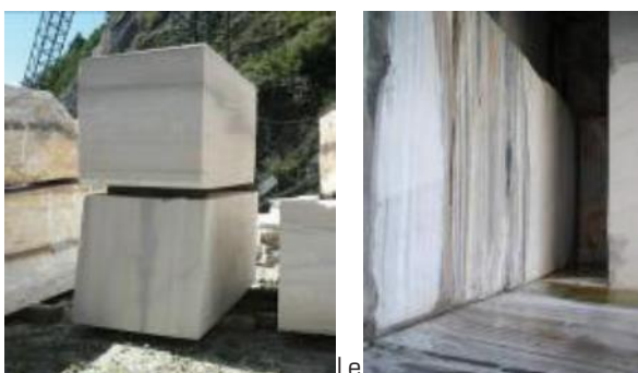
Fig. 3 - A sinistra, i blocchi ricavati dal taglio con filo, pronti sul piazzale. A destra, nella nicchia ricavata con tagliatrice a nastro, sono visibili venature grigio-rosa.

Il marmo di Candoglia è un materiale lapideo anisotropo, di colorazione variabile dal bianco al rosa al grigio, sia con tonalità omogenee sia con tonalità sfumate e con striature o venature. Le caratteristiche geomeccaniche sono state determinate con prove di laboratorio volte ad individuare la distribuzione di tali parametri ed il comportamento in condizioni elastiche e in prossimità della rottura. L'anisotropia è evidente sia nei blocchi sia in bancata (Fig.3).