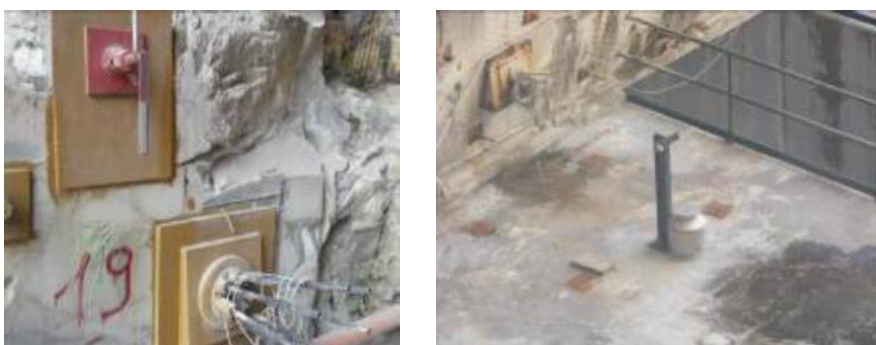
Fig. 5 - A sinistra il dettaglio di una mira topografica affiancata ad un tirante a trefoli strumentato con cella di carico anulare. A destra l'unità di oscillazione del pendolo diretto, il cui punto di sospensione è collocato sulla volta al di sopra del secondo travone trasversale.