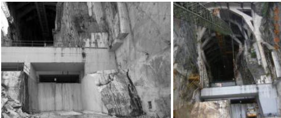
Fig. 2 - A sinistra la zona di imbocco in fase di preparazione per il taglio dello sperone di marmo sulla destra; le pareti sono consolidate con tiranti e bullonatura, per contribuire alla stabilità nei riguardi delle discontinuità sub verticali. Sulla destra la situazione più recente dell'imbocco della Cava Madre: in primo piano la prima delle travi puntone, sulla destra è stato rimosso l'ultimo sperone di marmo e a sinistra della pala gommata vi è il gradone isolato e pronto per l'estrazione, attuata con filo diamantato e ribaltamento della bancata . La resa in blocchi e lastre in tal caso cresce a valori oltre il 70%.

a recuperare porzioni di banco nella zona di imbocco, dato il particolare pregio del materiale: ciò ha reso indispensabile adottare importanti opere di sostegno aggiuntive, quali travi puntone orizzontali in c.a., in grado di consentire anche il futuro ribasso degli scavi al di sotto del livello attuale (Fig. 2). I consolidamenti delle pareti sono completati con tiranti multi - trefolo e barre cementate di chiodatura (Pelizza et al., 2010).