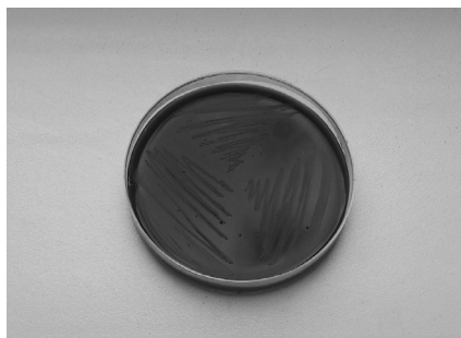
Slika 1. \gamma hemoliza laktobacila koji su zasejani na krvnom agaru

Hemolitička aktivnost je praćena za devet sojeva Lactobacillus spp. , kako bi se proverilo postojanje moguće patogenosti ispitivanih sojeva. Rezultati su dobijeni posmatranjem da li postoji zona hemolize na krvnom agaru posle 24h inkubacije na 37 °C (slika 1).