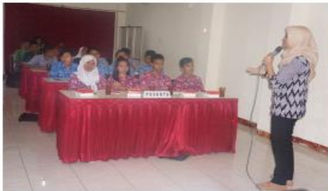
Gambar 3. Diskusi dan pemberian tanggapan dari pemateri

Pendidikan pemilih muda cerdas ini menjadi sebuah trigger agar mendorong partisipasi politik kaum muda dalam segala siklus atau tahapan pemilihan kepala daerah, maupun pemilihan lainnya. Pada dasarnya dengan adanya pendidikan pemilih atau politik akan membuat partisipasi politik kaum muda harus bermakna dan efektif dan lebih berkualitas.