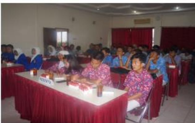
Gambar 2. Peserta pendidikan pemilih muda

Kegiatan pendidikan pemilih ini berdasarkan siklus pemilihan umum, yang terdapat periode sebelum pemilihan berlangsung, saat pemilihan dan setelah pemilihan. Kegiatan ini dilakukan pada bulan Februari 2018 yang merupakan masa sebelum pemilihan kepala daerah atau pre local head election . Berikut kegiatan sosialisasi yang dilakukan di Kabupaten Boyolali.