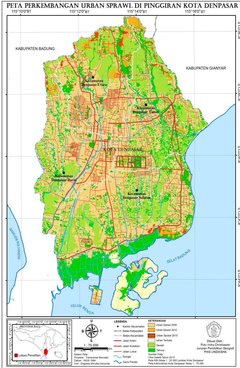
Gambar 1. Peta Perkembangan Urban Sprawl di Wilayah Pingiran Kota Denpasar