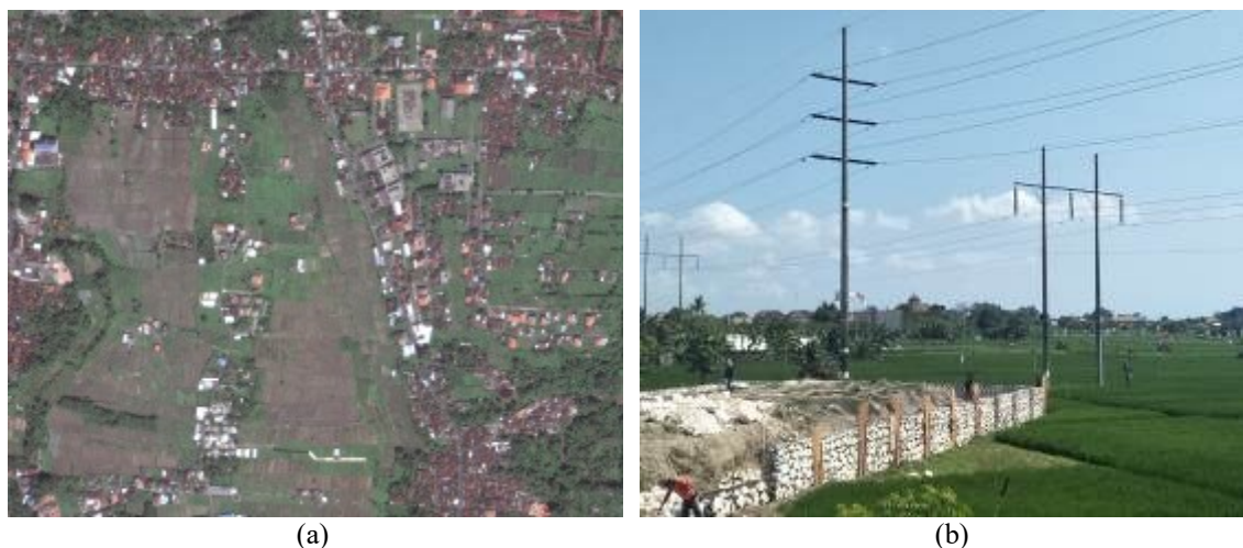
Gambar 2. (a) Citra Google Earth Leapfrog Development ; dan (b) Perubahan Tata Guna Lahan di Kecamatan Denpasar Utara