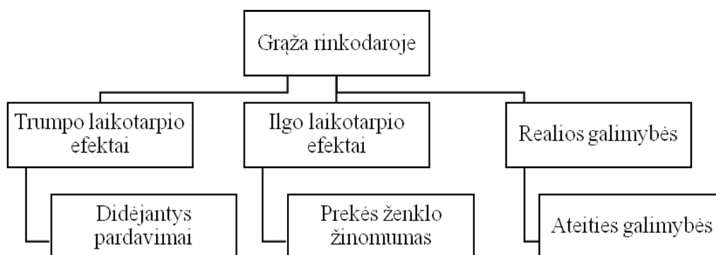
2 pav. Grąža rinkodaroje