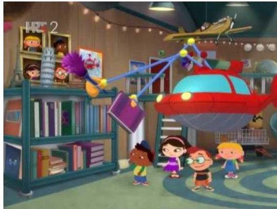
Slika 1. Crtani film Einsteinčići

Na slici 1. prikazan je crtani film Einsteinčići koji je pravi primjer edukativnog crtanog filma s poželjnim odgojnim porukama usmjerenim prema djeci. Epizoda u kojoj Einsteinčići traže rođendanski stroj, potiče uključenost djece koja gledaju crtani film tako što pomažu Einsteinčićima pri izvršavanju zadataka uz glazbeno poticajne aktivnosti kao što su ritam, pokreti, slušanje glazbe i zvukova. Crtani film pobuđuje kreativnost i maštu. Djeca se u epizodi upoznaju s novim gradovima i znamenitostima. Zajedničkim se aktivnostima potiče na suradnju te uvažavanje i prihvaćanje tuđih mišljenja i ideja.