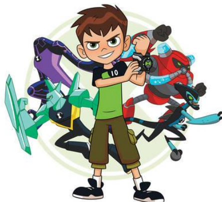
Slika 10. Crtani film Ben Ten

Na slici 10. prikazan je crtani film Ben Ten . Riječ o je crtanom filmu s nepoželjnim odgojnim porukama koji prikazuje nasilje, agresivnost i opasne crtane likove koji kod djece potiču neprikladno ponašanje.