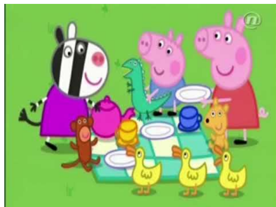
Slika 2. Crtani film Peppa Pig

Na slici 2. prikazan je crtani film Peppa Pig koji ima poželjne odgojne poruke usmjerene prema djeci. Epizoda u kojoj obitelj odlazi u šetnju prirodnom stazom djecu uči brojanju i snalaženju u prostoru. Nevoljom u kojoj se našla obitelj i patkice koje su im pomogle, potiče se kod djece pomaganje drugima u nevolji.