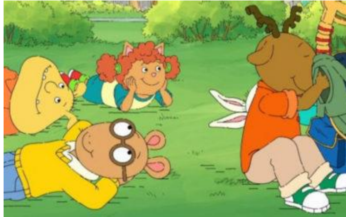
Slika 7. Crtani film Artur

Na slici 7. prikazan je Artur , crtani film koji ima poželjne odgojne poruke. Epizodom u kojoj opasna banda plaši sve ljude oko sebe i primjenjuje nasilno ponašanje osvještava djecu da takvo ponašanje nema učinka. Glavna je poruka epizode da se dobro dobrim vraća i da zato valja biti dobar prema drugima.