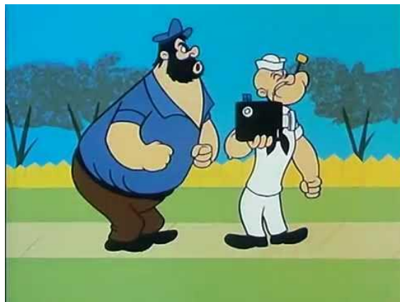
Slika 4. Crtani film Popaj

Gledajući epizodu crtanog filma Popaj primjećuje se grub odnos protkan nepristojnom komunikacijom i vrijeđanjem što potiče isto ponašanje kod djeteta, prikazivanje nesuradnje i međusobnog ismijavanja. Na slici 4. može se vidjeti glavni lik Popaj s Olivinim prijateljem s kojim se nadmetao u slikanju.