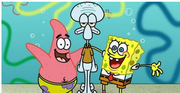
Slika 6. Crtani film Spužva Bob Skockani

Na slici 6. može se vidjeti crtani film Spužva Bob Skockani koji prikazuje sadržaj s nepoželjnim odgojnim porukama usmjerenim prema djeci. Epizoda u kojoj Kalamarko i Spužva Bob Skockani odraduju noćnu smjenu u restoranu potiče djecu na ismijavanje prijatelja neukusnim šalama te potiče kod djece strah od mraka. Takav sadržaj može uznemiriti djecu zbog strašnih priča i pobuditi im strahove.