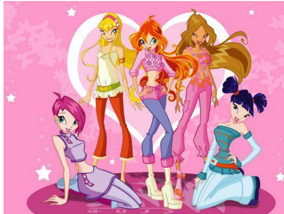
Slika 5. Crtani film Winx Club

Na slici 5. prikazan je crtani film Winx Club koji je nasilnog i agresivnog sadržaja jer je prikazano puno borbe. Epizoda u kojoj Winxice pokušavaju pomoći svojoj prijateljici u nevolji potiče kod djece i pozitivno ponašanje.