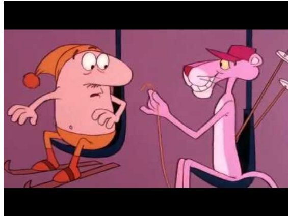
Slika 9. Crtani film Pink Panther

Na slici 9. prikazan je crtani film Pink Panther koji prikazuje sadržaj kroz zabavu, ali s nepoželjnim odgojnim porukama. U epizodi u kojoj je Pink Panther na skijanju prikazuje se sebičnost i dovođenje drugoga u opasnost. To kod djece potiče neispravno ponašanje.