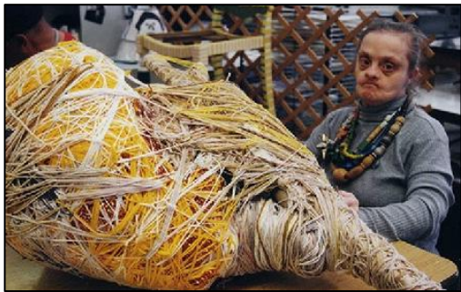
Imagen 8. Judith Scott con una de sus esculturas

En esta actividad se introducirá la figura de Judith Scott. Se realizarán preguntas previas al alumnado para comprobar qué saben acerca de esta artista.