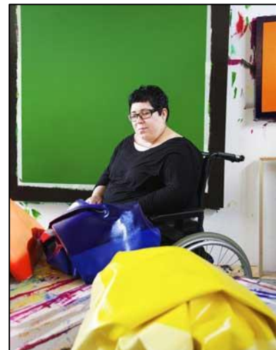
Imagen 3. Ángela de la Cruz

Estudió filosofía en la Universidad de Santiago de Compostela, y posteriormente se trasladó a Londres para estudiar Arte el Goldsmiths College y la Slade School of Art donde comenzó su carrera como artista profesional. Comenzó pintando, pero luego se movió hacia la escultura de gran tamaño. Lo que pretende con su obra es romper con la pintura tradicional sobre lienzo, pintando objetos que acaban convirtiéndose en esculturas.