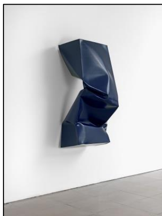
Imagen 11. Escultura Ángela de la Cruz (sin título)

Se concluirá la actividad remarcando que es esta misma sensación de “estar rota” o “estar enferma” lo que quiere mostrar Ángela de la Cruz con sus obras.