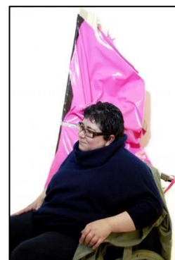
Imagen 10. Ángela de la Cruz

Se tantearán los conocimientos previos de los alumnos y alumnas respecto a la artista Ángela de la Cruz mediante preguntas. Posteriormente, los alumnos verán fragmentos del documental “Metrópolis – Ángela de la Cruz” de RTVE en el que se explica la vida y algunas de sus obras.