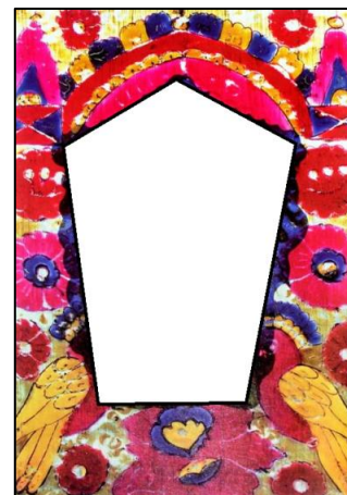
Marco para la realización del autorretrato

Se realizará una pequeña introducción al autorretrato, contando cómo Frida conseguía pintarse a ella misma