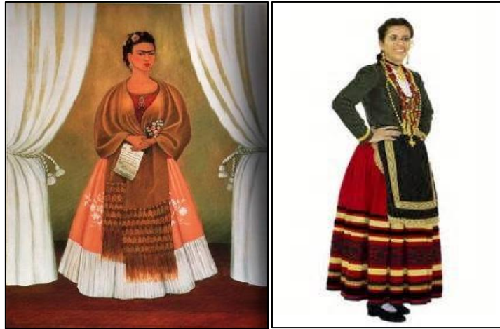
Imagen 6. Cuadro Frida Kahlo "Entre las cortinas" y traje regional de Castilla y León

traigan una fotografía con algún traje típico de su lugar de origen (o el de su familia) para compartirlo con el resto de la clase.