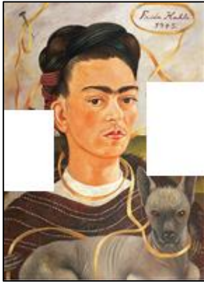
Cuadro incompleto Frida Kahlo: "Autorretrato con changuito"