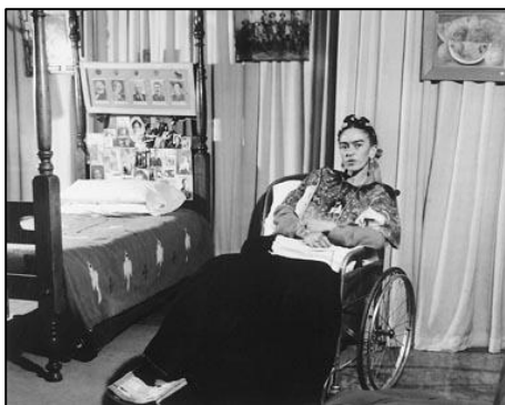
Imagen 2. Frida Kahlo

En 1922 ingresó en la Escuela Nacional Preparatoria para estudiar la carrera de