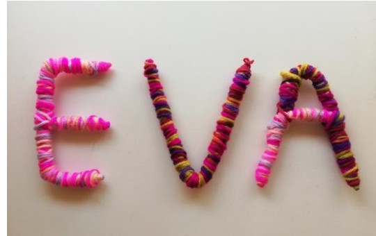
Ejemplo de la actividad con el nombre "EVA"