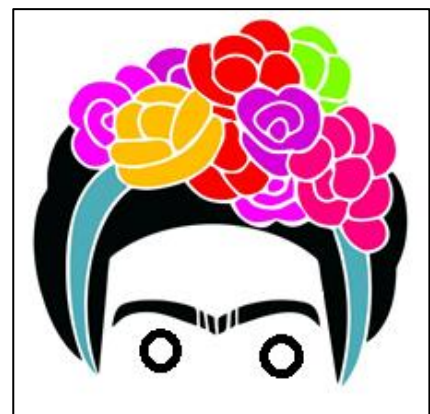
Modelo para la realización de la careta

Las alumnas y los alumnos realizarán una careta de Frida Kahlo, con sus características cejas y las flores en su pelo. Se pegarán pequeñas bolitas de papel cebolla en la corona de flores para darle colorido y se pintrará el resto de la cara. Se colocará una goma para sujetar la máscara. Por último, se realizará una foto grupal de todos los niños y niñas de la clase.