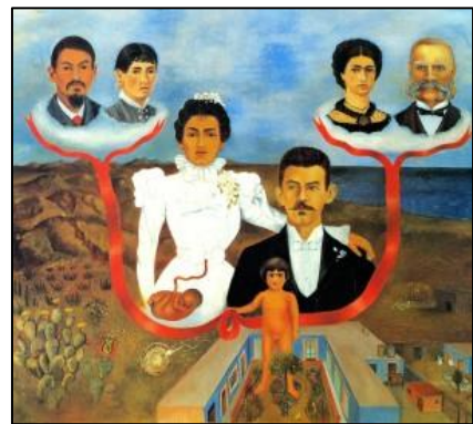
Imagen 7. Frida Kahlo: "Mis abuelos, mis padres y yo"

Se mostrará al alumnado el cuadro “Mis abuelos, mis padres y yo”, analizando las diferentes generaciones de la familia de Frida Kahlo. A partir de este, los alumnos y alumnas realizarán un collage , pegando fotos de sus familiares o realizando un dibujo de ellos, creando así su propio árbol genealógico. Se exhibirán los trabajos, destacando la posible variedad de familias que se pueden dar.