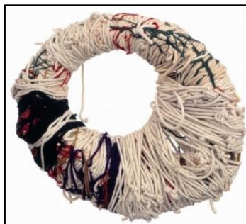
Imagen 9. Escultura de Judith Scott

Se incidirá en el hecho de que si miramos todas las esculturas de lejos, estas parecen iguales, pero si nos acercamos vemos como cada una de ellas es diferente y tiene unos matices. Cada alumno tratará de describir su creación. Se trabajará así la idea de “arte abstracto”: las obras no representan nada, pero sí que nos dicen cómo se siente la artista. Con esta creación y con los nombres que ellos mismos han realizado, se podrán abordar en este momento los conceptos de orden/desorden de los hilos y qué sensación produce a los niños, los conceptos de alegría/tristeza si nos centramos en el color de los hilos, etc.