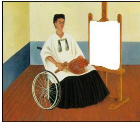
Cuadro incompleto Frida Kahlo "Autorretrato con el retrato del doctor Farill"