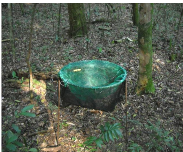
Figura 2: Aspecto de um dos coletores de serapilheira no fragmento florestal na Região da Depressão Central, São Sepé, RS, 2014.

Figure 2: Appearance of litter collectors in the forest fragment in the Central Depression region, São Sepé, RS, 2014.