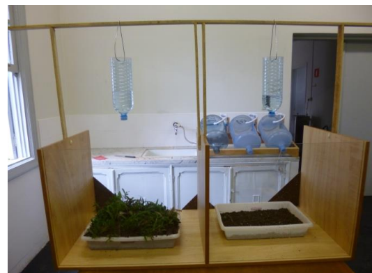
Figura 6: Experimento demonstrando que o impacto da gota da chuva é menor no solo com vegetação e maior no solo exposto (efeito splash).

Se eu desmatar o solo e chover, ele pode ser carregado pela chuva?