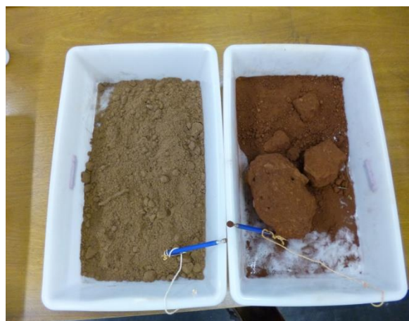
Figura 1: Magnetismo do solo. Solo da esquerda com pouco ferro e solo da direita com mais ferro.

Outra surpresa é quando utilizamos um ímã e mostramos que alguns solos são atraídos por ele e outros não, devido a presença do ferro.