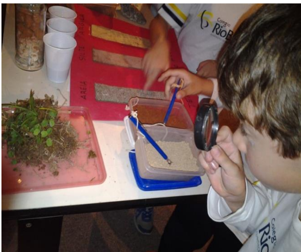
Figura 4: Observação de um torrão de solo e da textura do solo.

Mas o que tem no solo além de pedra e bichinhos? A oportunidade de ver que o solo tem areia, silte e argila e poder observar os grãos de areia e silte sob uma lupa é uma atividade muito enriquecedora. Como pode ter areia igual a da praia dentro do solo? E essa argila, dá para fazer um vaso com ela?