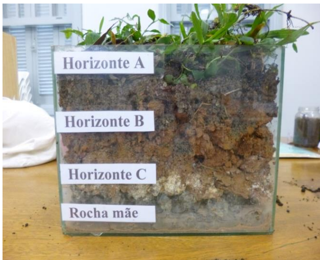
Figura 3: O perfil de solo.

O solo tem camadas de cores diferentes? O estudante pode observar os horizontes de um solo.