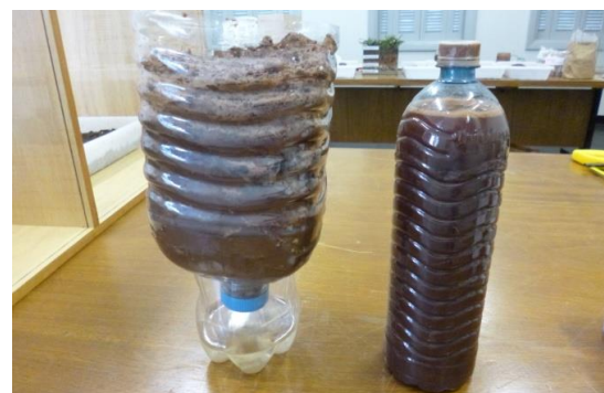
Figura 7: O solo como filtro. Observar que após a deposição da água barrenta, o solo filtra a água, que sai mais limpa.

O solo age como um filtro, por isso ele é facilmente contaminado quando resíduos poluentes são depositados nele.