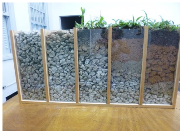
Figura 2: Formação do solo, da rocha sã até o perfil de solo.

Como pode o solo nascer de uma pedra? O conceito de intemperismo é desenvolvido em um experimento que mostra a rocha sã, depois a rocha já alterada, até a formação do solo e seus horizontes.