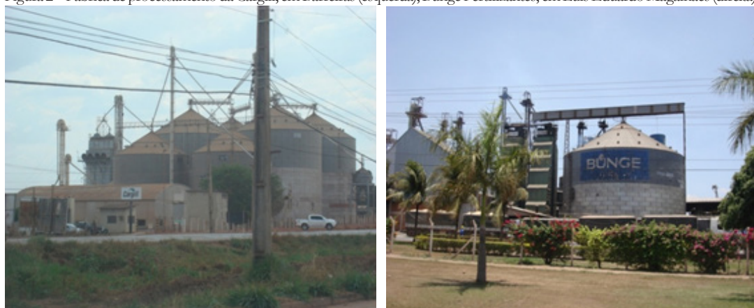
Figura 2 – Fábrica de processamento da Cargill, em Barreiras (esquerda), Bunge Fertilizantes, em Luís Eduardo Magalhães (direita).