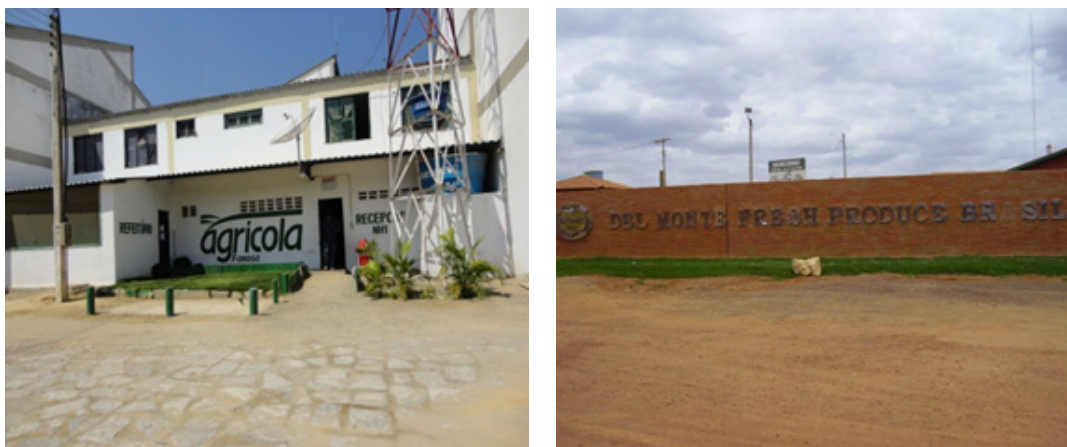
Figura 3— Empresa Agrícola Famosa, em Russas (CE). (esquerda), Empresa Del Monte, em Quixeré (CE) (direita).