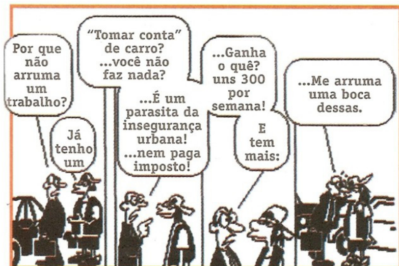
Figura 7- Elaborado pela Puccamp - SP

Ao analisar a Figura 7, é possível apontar o crescimento do trabalho informal nas grandes cidades, motivado principalmente pela falta de qualificação profissional, fato que acarreta inúmeras conseqüências para o país, haja vista que estes trabalhadores, em sua maioria, não contribuem para o sistema previdenciário, e conseqüentemente, ficam sem assistência quando se encontram, por algum motivo, impedidos de realizar suas atividades.