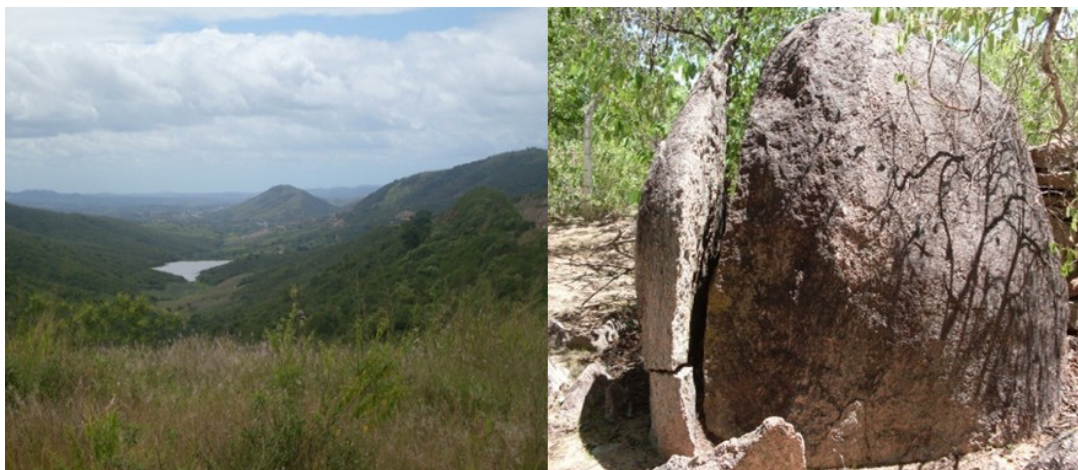
Figura 6- Vista do declive da Serra das Russas (escarpa do Planalto da Borborema), município de Gravatá, Agreste de Pernambuco (à esquerda). Imagem de uma rocha granítica sofrendo processo de intemperismo (esfoliação concêntrica) no interior do Parque da Pedra Furada, município de Venturosa, Agreste de Pernambuco (à direita).

Outra forma de imagem que pode ser largamente utilizada em sala de aula como instrumento de apoio para aulas dinâmicas são as charges, instrumentos que favorecem a interação e o debate em uma linguagem acessível e de caráter cômico.