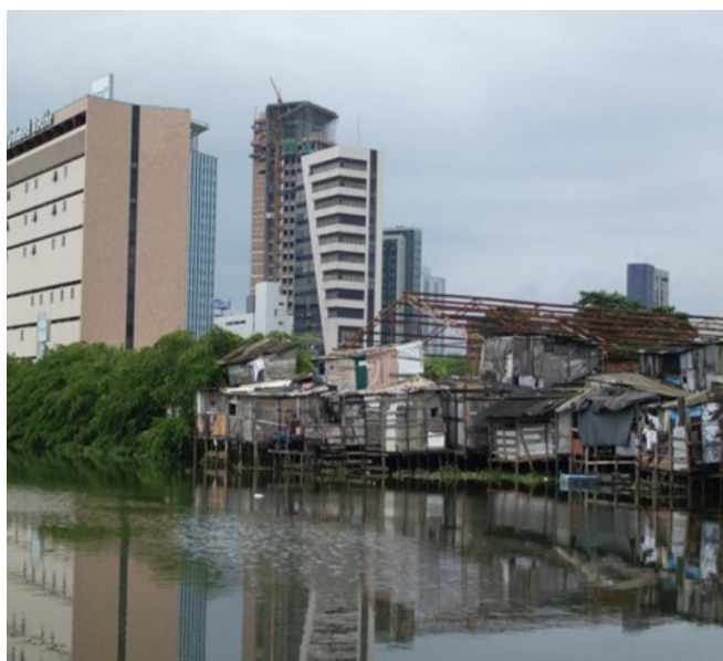
Figura 2- Contraste social no bairro dos Coelhos, centro da cidade do Recife-PE. As margens do rio Capibaribe a erradicação do mangue dá lugar a mocambos.