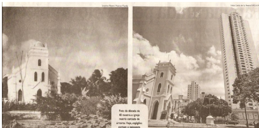
Figura 3- Praça da Vitória Régia, no bairro de Casa Forte em Recife-PE na década de 1940 (à esquerda). A mesma localidade em 2009 (à direita), com casarios e edifícios que substituíram a vegetação de outrora.