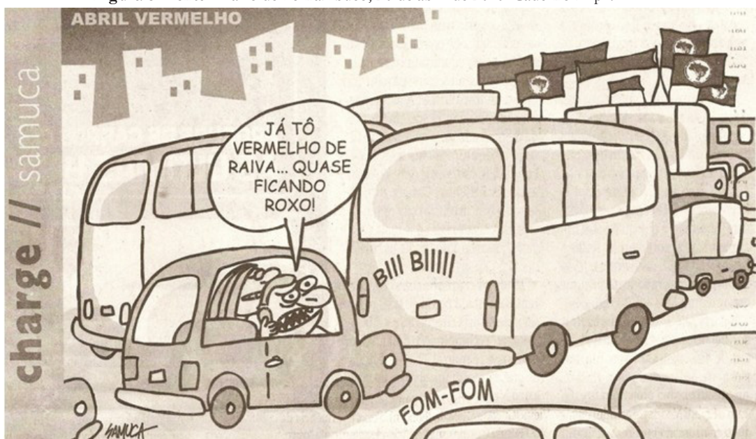
Figura 8- Fonte: Diário de Pernambuco, 20 de abril de 2010. Caderno B. p.4.

Outro ponto a ser destacado é a violência no campo provocada durante o processo de ocupações. Vale destacar ainda, o direito de ir e vir do cidadão previsto na constituição e que nesta situação é totalmente desrespeitado tendo em vista que, os manifestantes ocupam as principais vias das cidades provocando um caos generalizado no fluxo de pessoas e mercadorias.