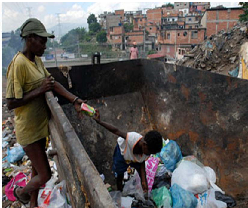
Figura 1- Criança catando lixo na periferia do Complexo do Alemão/RJ.