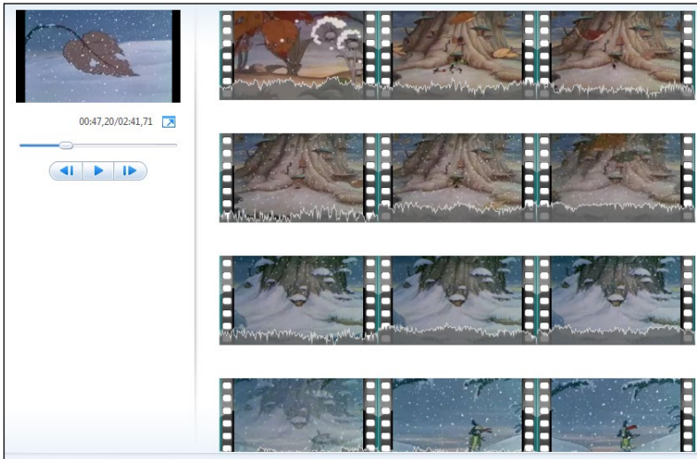
Figura 3. Exemplo de Tomada na fábula animada “A Cigarra e a formiga”

Essa Tomada (Figura 3) localiza-se no estágio do Gênero fábula identificado como Problema (Situação^Problema^Resolução^Fechamento/Moral – com base em FARENCENA; FUZER, 2012), que retrata a chegada do inverno e suas consequências negativas para a cigarra. O Quadro 1 (Figura 3) ainda faz parte da Tomada anterior, que realiza o prenúncio da complicação (queda das folhas e movimentos dos ventos, e, no áudio, uivo dos ventos e mudança para uma trilha musical dramática). Aos 4:30 10 minutos, observamos um corte por meio de crossfade 11 , que marca a troca entre Tomadas. A nova Tomada é um segmento de 18 segundos (4:30 a 4:48) que narra um conjunto de eventos situados ao pé do tronco onde moram as formigas: folhas carregadas pelo vento, carreiras de formigas deslocando-se apressadamente para dentro do tronco, nevasca, até que todo o local esteja despovoado e coberto de neve. Na Figura 3, essa Tomada compreende os Quadros 2 a 10. No Quadro 10, observamos novo crossfade e, assim, o corte que marca o fim da Tomada atual e início de uma nova.