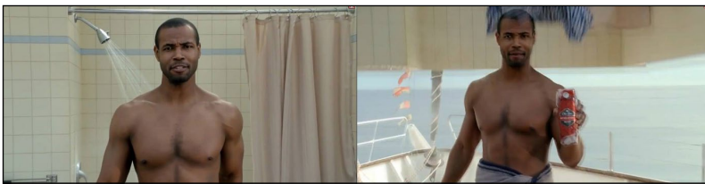
Figura 4. Edição por meio de alteração incongruente do cenário

Apesar da objetividade desse critério, nossa experiência em pesquisa com imagens em movimento tem nos colocado diante de novos desafios, como ilustra a Figura 4.