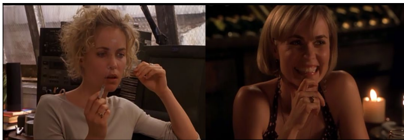
Figura 2. Quadro 1 e Quadro 2: representativos da Tomada 1 e Tomada 2, respectivamente (com base em KRABBE, 2014)

Reconhecemos que, ainda assim, recaímos na dependência do contexto, o que dificulta o estabelecimento de maior rigor científico na pesquisa em multimodalidade. Esses critérios, portanto, precisam ainda ser elaborados e testados em futuras investigações para que se tornem inteligíveis e amplamente aplicáveis tanto na pesquisa quanto na pedagogia dos multiletramentos.