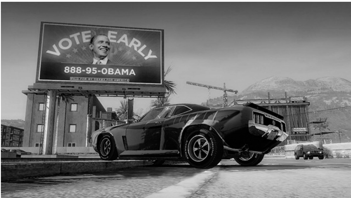
Figura 1 - In-game Advertising “da campanha presidencial de Obama no jogo Burnout .

O In-game Advertising é uma forma de realizar um product/brand placement (inserção de produtos/marcas em determinado conteúdo midiático) em um jogo, onde o ambiente é mais interativo e o usuário está com sua atenção voltada para o que está sendo exibido. A inserção de marcas em jogos pode até mesmo aumentar o realismo do jogo, principalmente em caso de simuladores, e por isso não ser percebida como invasiva, como por vezes ocorre em filmes e novelas. A Figura 1 mostra o In-game Advertising da campanha presidencial de Obama em 2008 no jogo Burnout .