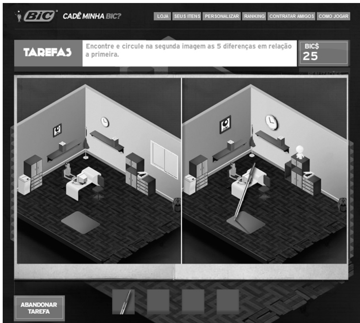
Figura 2 - Advergame “Cadê Minha Bic?”