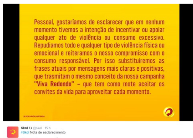
Figura 5: Comunicado de retratação da marca nas redes sociais

Depois do massacre virtual em fevereiro de 2015, a marca passou a introduzir a diversidade e o equilíbrio entre os gêneros em sua comunicação. “Já faz alguns anos que algumas imagens do passado não nos representam mais” (figura 5). Essa foi a frase de uma postagem feita pela Skol em seu canal no Facebook em 8 de março, Dia Internacional da Mulher desse ano.