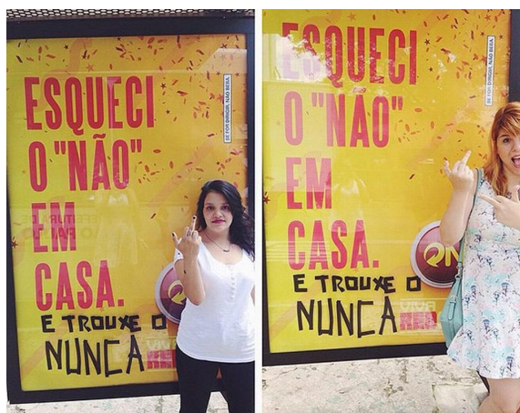
Figura 3: Crítica e interferência feita à campanha de carnaval de Skol