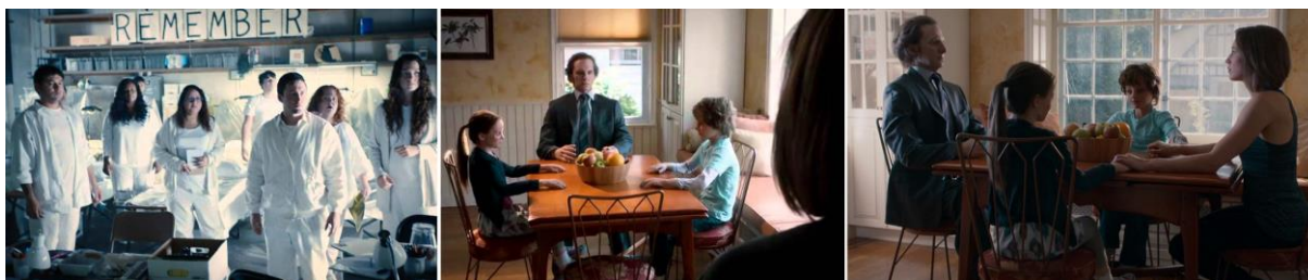
Figura 2 - De izquierda a derecha: los Guilty Remanents ; el reemplazo de los Ascendidos por maniqués; Nora contemplando a su familia.

Basta recuperar, entonces, uno de sus actos de mayor violencia simbólica en final de la primera temporada, mediante una doble operatoria que juega con las borduras del recuerdo. Se trata del hurto masivo de todas las fotografías de aquellos que han ascendido. La desesperación de una población que ha perdido la evocación visual del otro será expresada a través de extensas escenas que recorren los hogares, ubicando en primeros planos los portarretratos vacíos y el llanto de los dejados. Y aunque, en primera instancia, ello parece suponer un intento por forzar una memoria que ahora se ve desprovista de imágenes que colaboren en la recordación del ser perdido, el acto guarda una intención ulterior. Porque, con las fotografías secuestradas, los Remanentes fabricarán maniqués: copias exactas de los ascendidos que, durante el Memorial Day (fecha conmemorativa real que, casualmente, homenajea la memoria de los soldados estadounidenses caídos en guerra), colocarán en la posición exacta en la que se encontraban al momento de su partida.