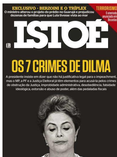
Figura 6: “Os 7 Crimes de Dilma. A presidente insiste em dizer que não há justificativa legal para o impeachment, mas o MP, a PF e a Justiça Eleitoral já têm elementos para acusá-la pelos crimes de obstrução da justiça, improbidade administrativa, desobediência, falsidade ideológica, extorsão e abuso de poder, além das pedaladas fiscais” (Isto É, 30/03/2016).

Três construções devem ser destacadas na capa abaixo: o título afirmativo jornalístico, ao anunciar em sua primeira parte os crimes da presidente. Em seguida, a construção jornalística atravessa o próprio ritual penal-judiciário – embora a este se reporte na forma de discurso indireto – para qualificar as infrações cometidas pela presidente. E, por último, a foto categorial.