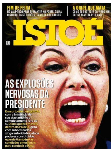
Figura 4: “As Explosões Nervosas da Presidente. Em surtos de descontrole com a iminência de seu afastamento e completamente fora de si, Dilma quebra móveis dentro do palácio, grita com subordinados, xinga autoridades, ataca poderes constituídos e perde (também) as condições emocionais para conduzir o País” (Isto É, 6/4/2016).