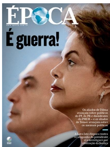
Figura 3: “É Guerra! Os aliados de Dilma avançam sobre políticos do PP, do PR e dissidentes do PMDB – e os aliados de Temer avançam sobre os mesmos políticos” (Época, 02/04/2006).