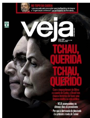
Figura 9: “Tchau, querida; tchau, querido. VEJA acompanhou os últimos dias da presidente” (Veja, 11/05/2016).

O discurso midiático não poderia ser apenas um lugar testemunhante da saída da presidente de cena política, conforme mostraram algumas das operações aqui descritas, especialmente aquelas em que o dispositivo se “instala” para conferir sentidos ao seu deslocamento, como observado na Figura 9. Tão pouco, o sentido desta passagem poderia ficar facultada à leitura do receptor. Assim, como o dispositivo prepara, fecha também o circuito de sentidos desencadeados por suas gramáticas e lógicas. Numa espécie de solenidade de despedida, a capa (Fig.9) se transforma em um cenário no qual Dilma e Cunha, modelizados em torno de imagens que procedem de outro lugar, os mostra em situação de indiferença, para ouvir a mensagem de despedida que vem da esfera midiática.