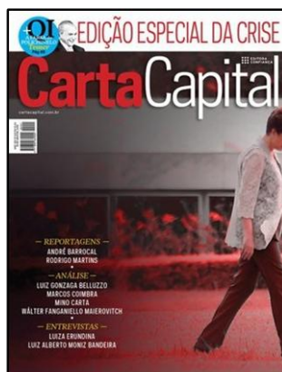
Figura 8: “Edição Especial da Crise. Reportagens – Análise – Entrevistas” (Carta Capital, 18/05/2016).

Em uma outra edição especial (Fig. 8), dá-se um outro passo da narrativa de um impeachment antecipado. Se nos anteriores, ouviu a qualificação dos seus crimes e foi entregue para o julgamento, a presidente é agora, retirada de cena. A capa, desta feita, não traz nenhum título evocativo, a não ser ao status da edição bem como aos títulos de algumas secções nas quais se identifica reportagens, análises e entrevistas sobre o assunto.