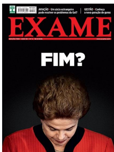
Figura 7 “FIM?” (Exame, 15/03/2016).

Possivelmente, a figura 7 reúna, na sua “simplicidade” gráfica, uma das operações referenciais mais complexas. Imagem de fundo preto, tomando toda a extensão da página, o processo enunciativo maneja literalmente com o corpo da presidente. De blusa vermelha, para contrastar com o fundo preto – e para associá-la as cores do PT – expõe a cabeça da presidente, literalmente, cabisbaixa. Mas, sobre a cabeça uma interrogação (?) que, aparentemente, suspende o teor de julgamento do enunciado. O dispositivo jornalístico se afasta formalmente da sentença, mas pela organização do enquadre enunciativo, é o sujeito institucional da enunciação (EXAME) quem interpela os julgadores de Dilma. E, ao mesmo tempo anuncia: “Eis a ré”.