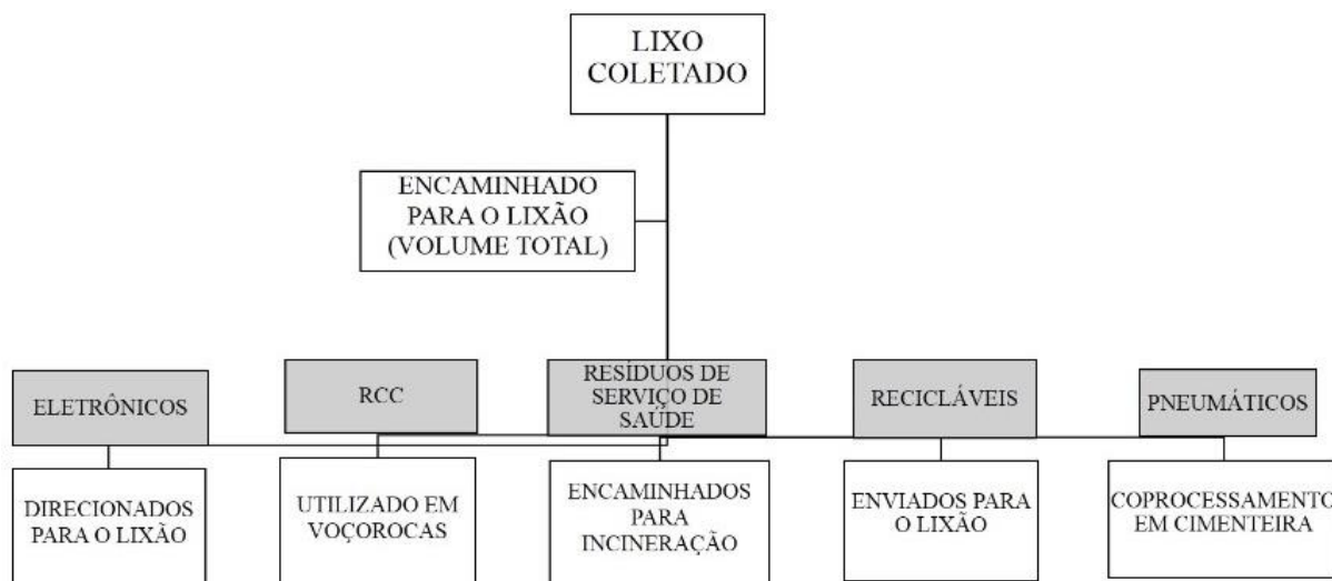
Figura 1 – Esquemática da destinação dos resíduos coletados em Professor Jamil.

acidentes ocupacionais ou de dano ambiental (ANVISA, 2004). O processo de destinação final dos resíduos coletados no município segue processos diferenciados, conforme apresentado na figura 1.