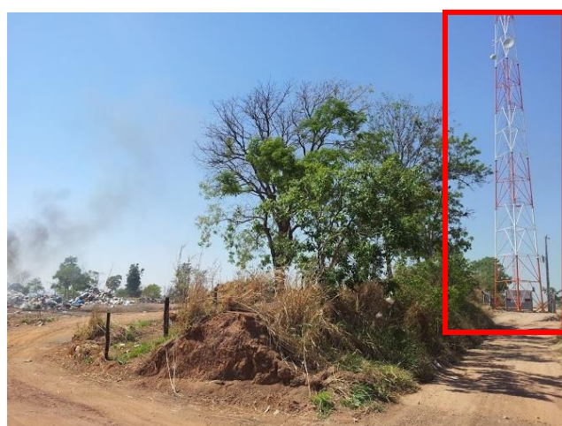
Figura 7 – Em destaque vermelho, torre de comunicação próxima a área de disposição final. Fonte: Autores.

De acordo com o secretário de meio ambiente, os resíduos de serviço de saúde (RSS) são encaminhados para uma empresa de incineração, os pneus são recolhidos e enviados para coprocessamento em uma cimenteira e os RCD são utilizados pela prefeitura para recobrimento de voçorocas. Entretanto, em uma das visitas ao lixão, foram encontrados pneus (Figura 8). Segundo a Resolução de Nº 358 de 2005, Para os municípios ou associações de municípios com população urbana até 30.000 habitantes, conforme dados do último censo disponível do IBGE, e que não disponham de aterro sanitário licenciado, admite-se de forma excepcional e tecnicamente motivada, por meio de Termo de Ajustamento de Conduta, com cronograma definido das etapas de implantação e com prazo máximo de três anos, a disposição final em solo de RSS obedecendo aos critérios mínimos estabelecidos no anexo II da Resolução, com a devida aprovação do órgão ambiental competente.