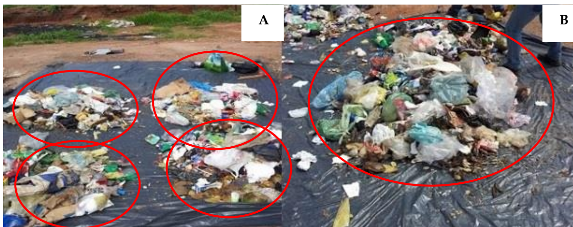
Figura 4 – A) Divisão do volume em quatro partes. B) Mistura do volume anteriormente separado para posterior divisão em dois, mistura novamente, segregação dos grupos previamente escolhidos na diagonal e por fim a pesagem desses.