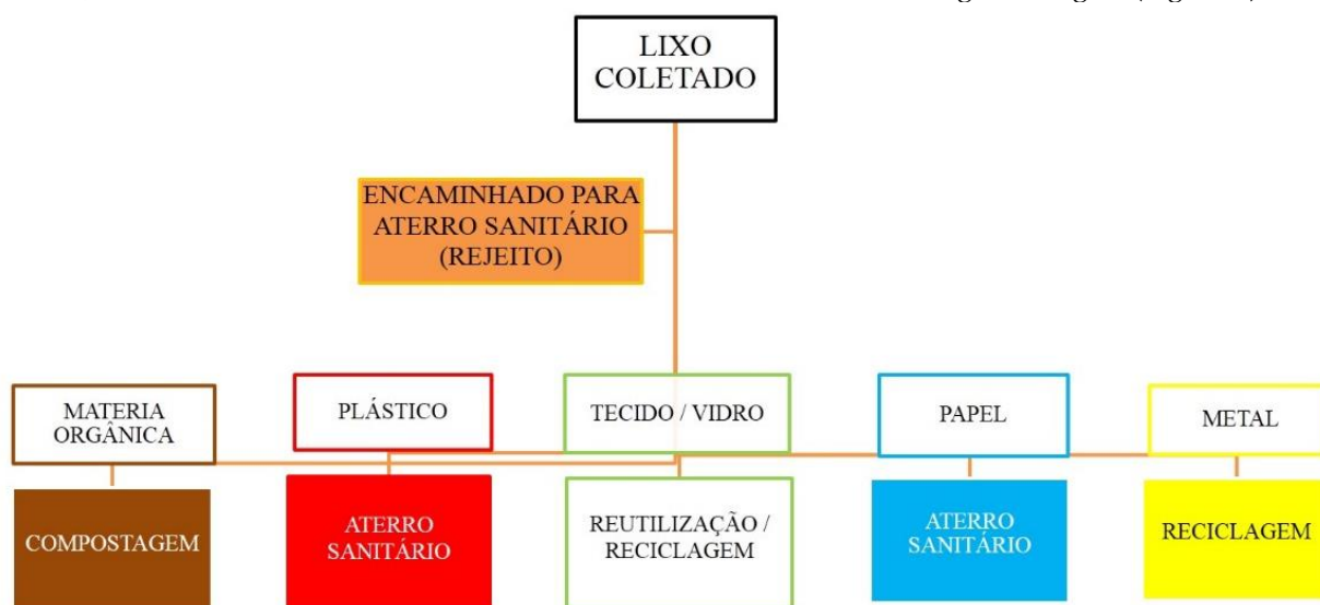
Figura 9 – Alternativas para os diferentes resíduos considerando a existência de um aterro sanitário.

Entre os materiais encontrados com alto potencial para reciclagem estão os metais. O alumínio foi o de maior presença. Diferente do encontrado pela empresa responsável pelo PGIRS do município, não foram encontrados resíduos de borracha. Como alternativa para destinação final dos diferentes materiais, sendo considerada a existência de um aterro sanitário especialmente para os resíduos de Professor Jamil e sem a existência de um consórcio, tal como no indicado na figura a seguir (Figura 9).