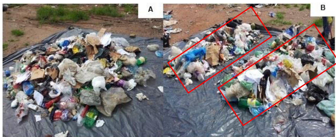
Figura 3 – A) Início do quarteamento, com o despejo do material em lona. B) Divisão do volume total em duas partes. Fonte: Autores.