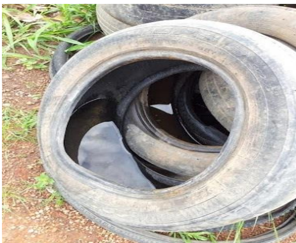
Figura 8 – Pneus encontrados na área do lixão.

de voçorocas, algumas das possíveis consequências são a contaminação do lençol freático por restos de tintas e outros tipos de materiais não inertes, além do carreamento de RCDs para áreas que estão em uma cota abaixo da área de disposição.