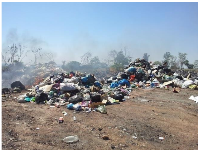
Figura 6 – Queima do material disposto no lixão de Professor Jamil.