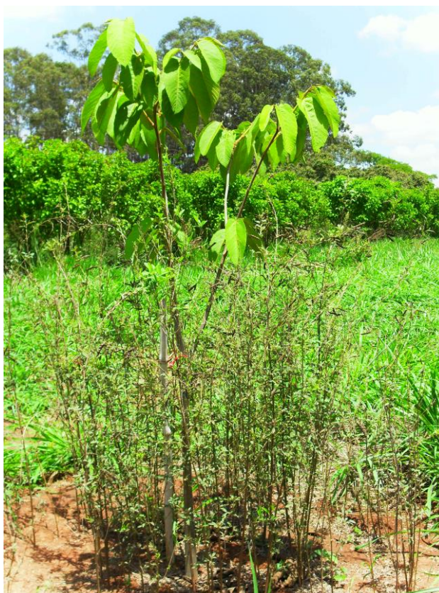
Figura 2 – Adubos verdes em consórcio com nativa do Cerrado.

Os adubos verdes são plantas com características que possibilitam a melhoria em médio e longo prazo de propriedades físico-químicas do solo, redução na competição entre espécies, além do cultivo para fins comerciais. Em regiões semiáridas, os adubos são cultivados para utilização como cobertura morta em áreas com histórico de manejo inadequado do solo e baixa precipitação. Alguns exemplos de adubos verdes são Cajanus cajan (feijão guandu), Crotalaria juncea (crotalária) e Stylosanthe multilinea (estilozantes). Em APPs em processos de revegetação, essas espécies podem ser utilizadas em consórcios com espécies arbóreas (Figura 2).