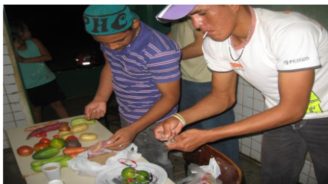
Figura 2 - Alunos participando e interagindo na gincana elétrica

Em um contexto geral, os alunos prestaram atenção e interagiram com os professores e colegas no desenvolvimento do experimento. Evidenciou-se nesse experimento o uso de dois paradigmas construtivistas, são eles, o interacionismo de Piaget, pois os alunos interagiram com o meio para desenvolver conhecimento, e o segundo paradigma construtivista foi, o socio interacionismo de Vigotsky, pois os alunos trabalharam o social, ou seja eles tiveram que pensar em equipe para construir conhecimento.