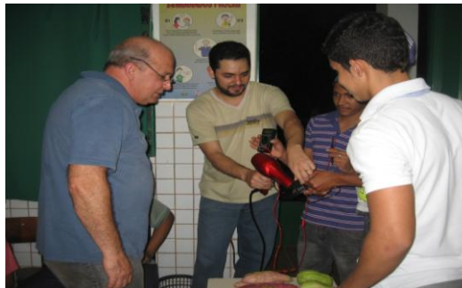
Figura 1 - Alunos observando o experimento da energia eólica

O experimento da energia eólica foi uma atividade proposta à sala, para identificar na prática as teorias já conceituadas. O secador ao ser ligado produz vento que foi captado pelas hélices do cooler, que as fizeram girar em alta velocidade, transformando energia eólica em elétrica, que resultou no acendimento do led (Figura 01).