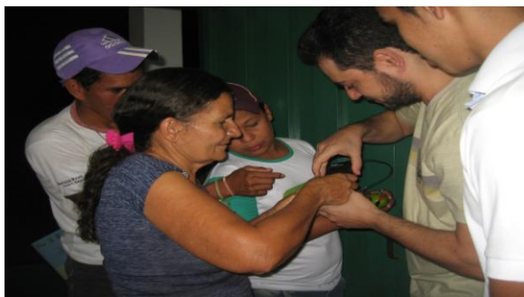
Figura 1 - Alunos realizando cálculos com a calculadora ligada por meio de limões