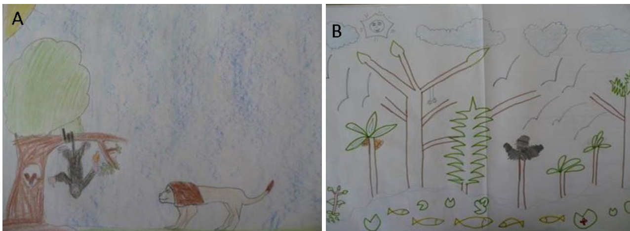
Figura 3: Produção de desenhos dos alunos relacionados ao tema de flora e fauna do Parque Metropolitano de Pituvaçu. (A) Desenho criado pelos alunos na fase conceitual. (B) Desenho criado pelos alunos na fase procedimental.

Ao avaliarmos os desenhos produzidos pelas crianças dos dois grupos (fase conceitual e fase procedimental), com a assessoria de uma psicopedagoga percebemos indícios de um aprendizado dos alunos após a atividade procedimental (Figura 3a e 3b). Portanto, considerando-se que de acordo com Morales (2004), os desenhos, pintura e poesia, proporcionam aos participantes a representação simbólica dos seus conceitos, instigando sua imaginação, criatividade e liberdade de expressão e a dramatização e que Goldberg (2005) acredita que a partir do desenho a criança organiza informações, processa experiências vividas e pensadas, revela seu aprendizado e pode desenvolver um estilo de representação singular do mundo.