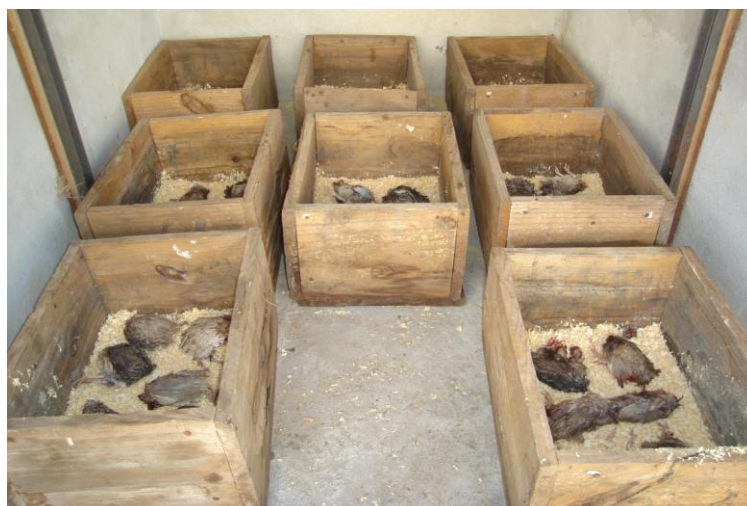
Figura 1. Composteiras em caixas de madeira.

O processo de compostagem, que teve duração de 35 dias, foi realizado em caixas de madeira não tratadas, nas dimensões de 0,50 m de comprimento, 0,40 m de largura e 0,30 m de altura (Figura 1). A escolha dessa estrutura foi baseada no seu baixo custo para pequenos produtores rurais. As carcaças de codornas ( Coturnix coturnix japonica ), a maravalha e a cama aviária foram obtidas junto ao LEEZO. A cama aviária de um lote de frangos de corte foi utilizada como inóculo.